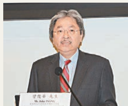
香港財政司司長曾俊華。

辭表示,香港可以在國家「一帶一路」的建設中,擔當投資者、中介者和支援者三個不同的角色,配合國家的發展策略。他指出,香港是亞洲最大的資產管理中心,管理資產超過2萬億美元,也是全球最具規模的離岸人民幣中心,人民幣資金池規模超過1萬億人民幣。這些資金可以協助「一帶一路」沿線地區項目的融資。曾俊華又稱,香港一直是國際商貿中心,