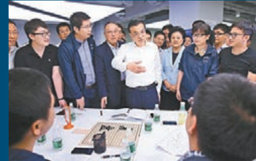
李克強來到聯想之星,考察為科技人員創業創新服務情況。