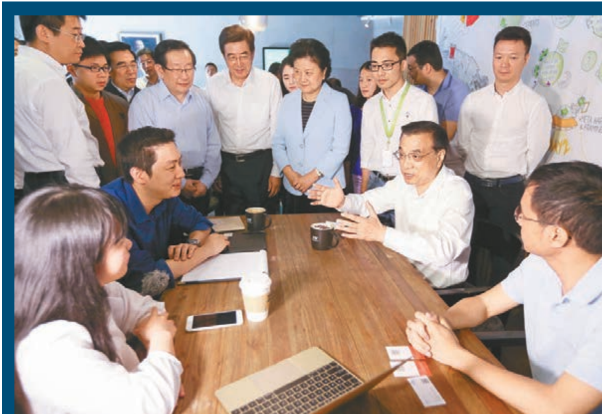
李克強在3W咖啡屋,與創業者邊喝咖啡邊交流。

「總理在法律窗口停留的時間最長,大概有三、四分鐘。」海澱區區長于軍說,「在政策窗口,我們則介紹了園區的优惠政策,比如主要是給創業者提供諮詢。」當總理問及服務是否收費時,于軍指着窗口的牌子說,「這裡貼了22項免費法律諮詢的項目,可以說前期全是免費的,只有到後期客戶有進一步的法律需求時,我們才按照司法局的標準,再打個折扣,向客戶提供一個比較優惠的價格。」接着,總理又問到創業會客廳設立法律窗口的出發點,一位工作人員則回答稱,「四中全會推進依法治國,我們也很重視市場規範的指導作用。」于軍表示,此平台主要是給創業者提供一條龍的第三方服務,比如設立公司時的「多證連辦」,還有法律、財務諮詢等。