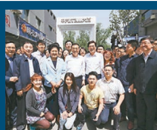
李克強來到中關村創業大街考察。