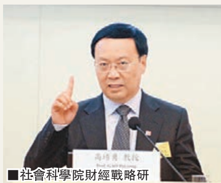
社科院財經戰略研究院院長高培勇。

高培勇對今年實現「保七」充滿信心,但稱是否已見底難以預料,未來經濟增長有可能低於7%。高培勇表示,中央的經濟政策思路有重大調整,包括由過往在前線招商引資、擴大投資,改為維護公平競爭市場環境和促進創新。政府亦不再一見經濟變化就出手干預,造成扭曲市場的錯誤。高培勇又稱,「經濟發展速度有起伏很正常,只要在合理範圍內波動就不必大驚小怪」,只有在可能滑出合理區間時,中央才會加大調控力度。香港財政司司長曾俊華在同一場合致