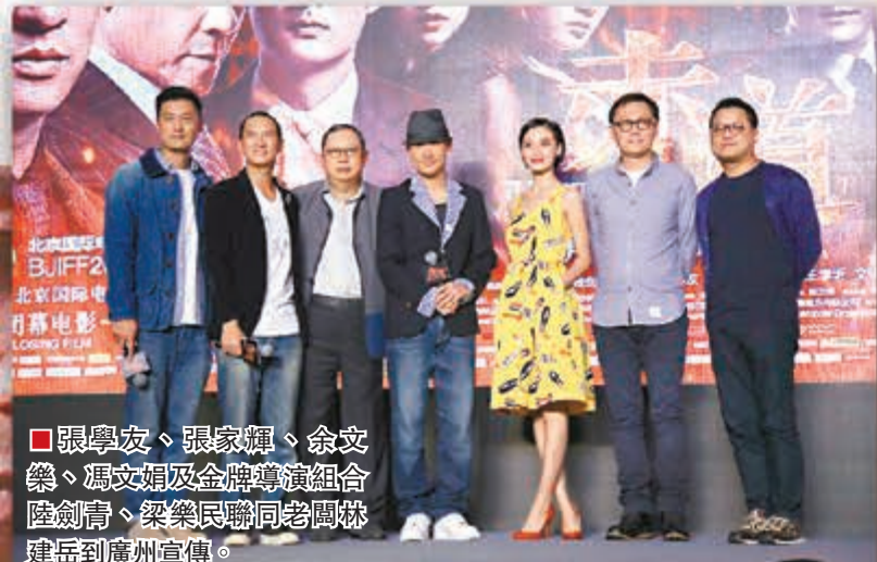
張學友、張家輝、余文樂、馮文娟及金牌導演組合陸劍青、梁樂民聯同老闆林建岳到廣州宣傳。