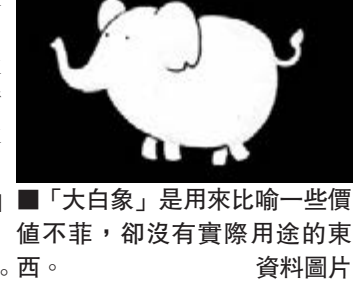
「大白象」是用來比喻一些價值不菲，卻沒有實際用途的東西。西。資料圖片

象是體型巨大的動物，是龐然大物，平日行動十分緩慢。由此引伸，一些規模龐大、制度繁複的大機構、大企業，都會比喻作大象。