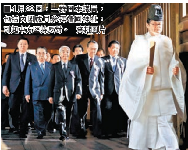
4月22日，一羣日本內閣成員，包括內閣成員參拜靖國神社，引起中方堅決反對。資料圖片

Learning Point 譯文中有使用only加強語氣 (emphatic use of "only") 的例子: 1. Only when the Japanese faithfully regard and deeply regret their history of aggression, and completely depart from militarism, will she be able to build a healthy and steady relationship with China.