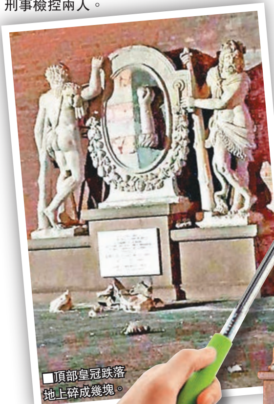
頂部皇冠墜落地上碎成幾塊