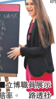
立博職員展示賠率。