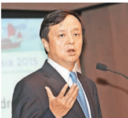
■港交所行政總裁李小加傳有機會與台灣金融代表團會面，並就「台港通」再作探討。

香港文匯報訊(記者 周紹基) 據台灣傳媒報道，台灣「立法院」「立委」已安排在下周到訪香港考察，隨團有「財政部」、金管會、證期局及證交所的代表。據悉，港交所(0388)行政總裁李小加有機會與代表團會面，並就「台港通」再作探討。