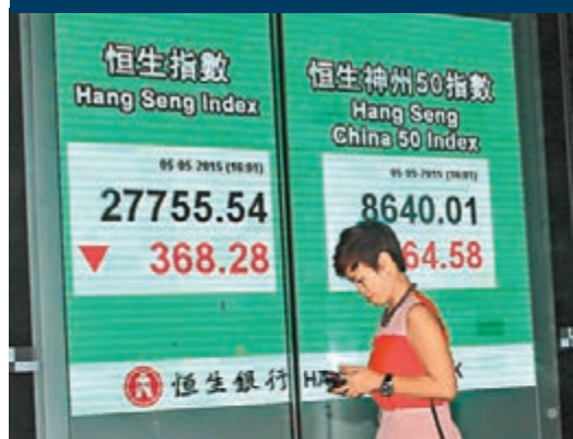
■港股恒指昨先升後回，全日高低波幅達718點，收市跌368點。

香港文匯報訊(記者 周紹基) 經歷急升逾3,000點的4月後，港股與A股一樣，開始在5月從高位回調，「五窮月」魔咒或重現。上證綜指和深證成指昨日突然大插水，雙雙急瀉逾4%，拖累港股先升後跌，最多曾跌過525點，中資股成重災區。恒指全日收跌368點或1.3%，失守10天線(28,096點)，收報27,755點，上下波幅多達718點，成交1,778億元。恒生國企指數更慘瀉381點或2.6%，