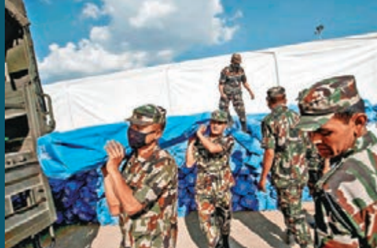
救援人員搬運物資。