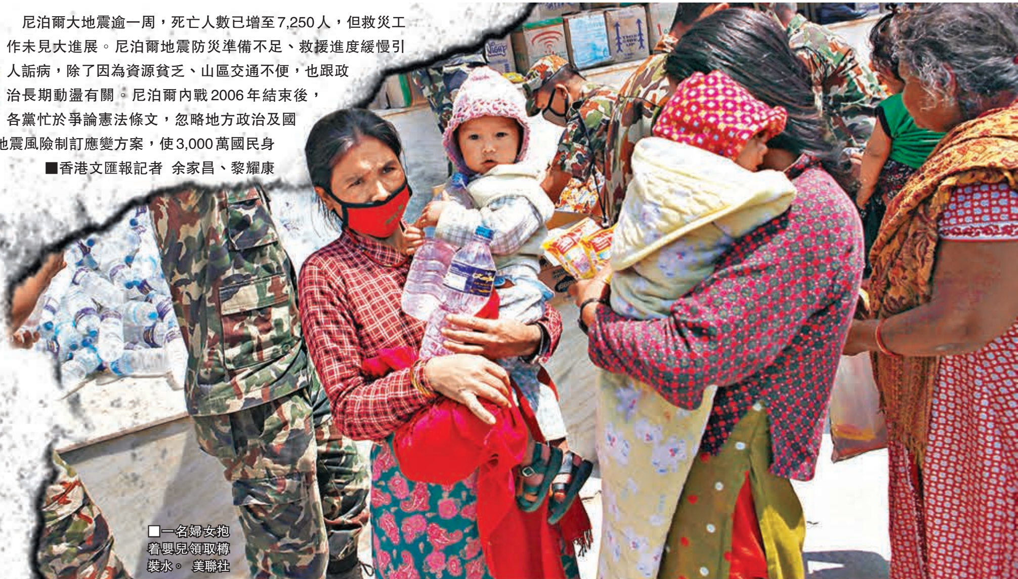
一名婦女抱着嬰兒領取樽裝水。

總理柯伊拉臘地震時正在印尼外訪，他提前結束行程回國。在野尼泊爾共產黨(毛主義)發言人沙爾馬批評柯伊拉臘救災反應遲緩，態度亦欠敏感。柯伊拉臘強調救災已盡全力，又親自到加德滿都的醫院探望災民，承諾向地震遇難者親屬派發10萬盧比(約7,604港幣)恩恤金。