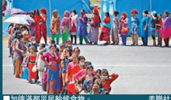
加德滿都災民輪候食物。