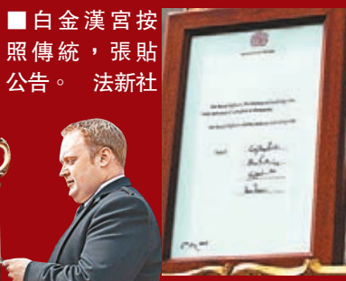
白金漢宮按照傳統，張貼公告。