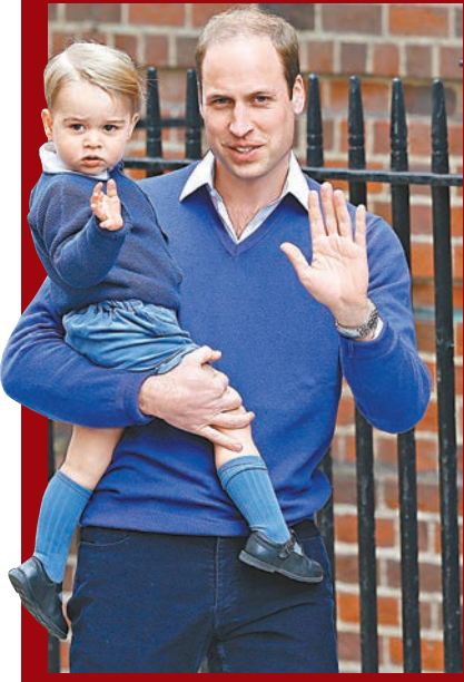
凱特誕下小公主後，威廉及兒子喬治首次露面。