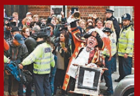
公告員在醫院外搖鈴，宣布凱特誕女的消息。網上圖片

將會受惠，為她設計服裝的不在話下，即使是跟風模仿的亦會因此獲益。為慶祝小公主出生，英國皇家鑄幣廠宣布會向2,015名同日出生的嬰兒，贈送刻有英女王肖像及出生年份的幸運紀念銀幣。皇家鑄幣廠早前已宣布推出5英鎊紀念幣的計劃，皇家收藏信託亦計劃推出包括杯碟等王室BB紀念品。美聯社/《每日電訊報》