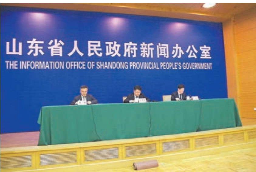
■山東紡織服裝展銷會將於月底舉行。圖為新聞發布會現場。

香港文匯報訊（實習記者 朱明麗 山東報道）山東正大力推進紡織服裝產業轉型升級，作為該項工作的重要措施，山東紡織服裝展銷會將於5月25日至27日在濟南舉行，其間將舉行創意發布秀、線上線下展銷、工商對接採購等活動。