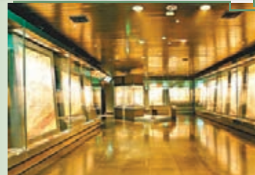
■陝西歷史博物館唐墓壁畫珍品館收藏唐墓壁畫精品近600幅。

記者近日從陝西省文物局獲悉，「陝西壁畫保護修復研究基地」上月30日在陝西歷史博物館揭牌。該基地將培養一批具一流水平的學術帶頭人，引領國內壁畫保護修復研究水平，成為國內外具有較強吸引力的開放式文物保護交流平台。該基地以陝西歷史博物館壁畫保護修復研究中心為依托而組建。以基礎研究和應用基礎研究為主，以理事會形式運行和管理。基地將建立專家庫，首批專家庫名單包括壁畫保護22人、壁畫研究15人和壁畫藝術15人。基地學術委員從專家庫中產生。基地主要職責是制定館藏壁畫整體保護規劃、制定館藏壁畫保護修復標準、建立館藏壁畫基礎資料信息數據庫等。