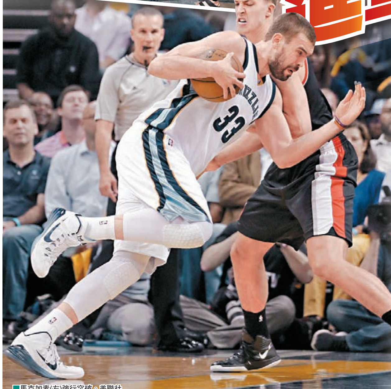
馬克加索(左)強行突破。

孟菲斯灰熊昨日於主場以99：93擊敗波特蘭拓荒者，奪下系列賽第4勝，以4：1戰績將拓荒者淘汰，晉級NBA季後賽第2輪，是他們5年內第3度進軍西岸4強，接下來將挑戰聯盟戰績最佳的金州勇士。