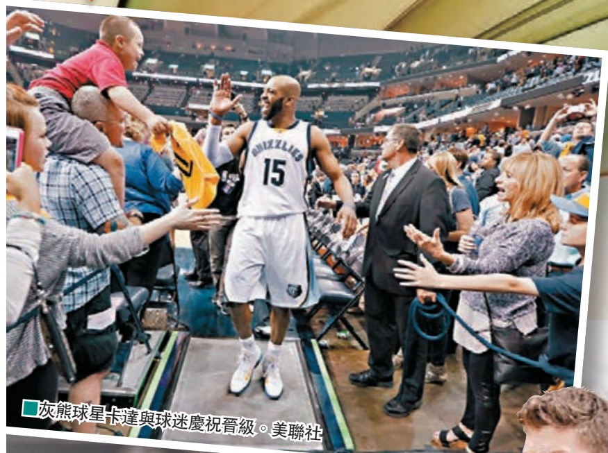
灰熊隊球星卡達與球迷慶祝晉級。