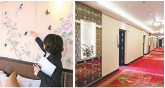
蘇繡師傅一針一線將花鳥繡在客房床頭。客房走廊布置以「竹菊蘭梅」為主題。

「竹菊蘭梅」飾走廊 蘇繡床頭 過去圓山飯店客房走廊布置是以唐宋元明清畫作為主題,為讓觀光客更易看懂中華文化,改以竹菊蘭梅四大主題布置走廊,不只地毯、牆壁、天花板上圖案,牆上也擺有和竹菊蘭梅相關的