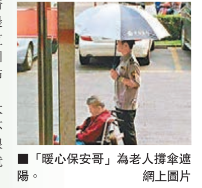
「暖心保安哥」為老人撐傘遮陽。

香港文匯報訊 據《南國都市报》報道,近日網上流傳一張海南海口一名銀行保安在烈日下為老人撐傘遮陽的照片,引來眾多網友點讚,並稱之為「暖心保安哥」。 照片中,一位老人坐在輪椅上,低著頭,似乎已經睡著,邊上一位保安員撐著一把傘,筆直地站在他身旁,為老人遮陽。圖片的發佈時間是4月25日,發佈者在配圖文字中說:「前些天,去銀行辦點事,來了一對老太太和老大爺,老大爺由於怕麻煩不方便,就在門口候著,太陽很曬,熱得要命,保安哥拿著傘就過去了……讚一個!」