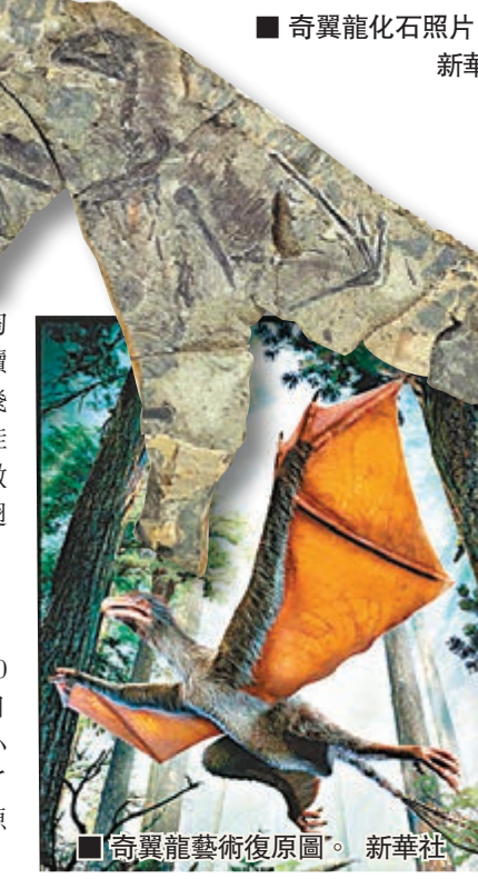
奇翼龍化石照片。

滑翔。在奇翼龍標本上,研究者也在棒狀結構和手指附近發現了殘缺翼膜。這意味著奇翼龍的翅膀像蝙蝠等四足動物一樣,主要由翼膜構成,而不是像鳥類翅膀主要由羽毛構成。 徐星介紹說,為了揭示這一標本保存的重要信息,尤其是確認該棒狀結構的性質,科研人員採用了CT和掃描電鏡等多種儀器對化石進行分析,最終確認此結構是翼膜翅膀的關鍵組成部分。 鄭曉廷稱,奇翼龍生活在侏羅紀中期,因此牠算是在鳥類支系飛翔演化過程中的一個先鋒。在飛翔演化的早期歷史中,許多支系被淘汰,只有現生鳥類的飛行模式延續至今。奇翼龍的發現,為翼狀飛行器官的趨同演化提供了一個絕佳實證,表明即使是在以羽翼為特徵的鳥類支系上,也曾出現過翼膜翅膀。