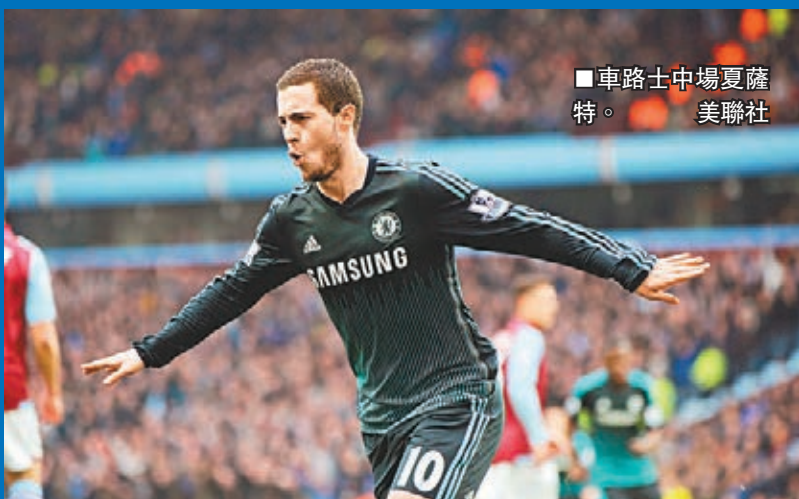
■車路士中場夏薩特。

「李城」就算全力出戰，亦絕不是「車仔」對手；加上，車路士在餘下5輪英超只需多取6分，即可重奪失落了5年的聯賽冠軍，今仗絕不會腳軟。再者，「車仔」主帥摩連奴賽前證實奧斯卡與迪亞高哥斯達有機會出戰「李城」；而且表明不會離隊的夏薩特狀態甚勇，此子近5輪聯賽攻入3球。這樣看來有傳已定5月25日舉