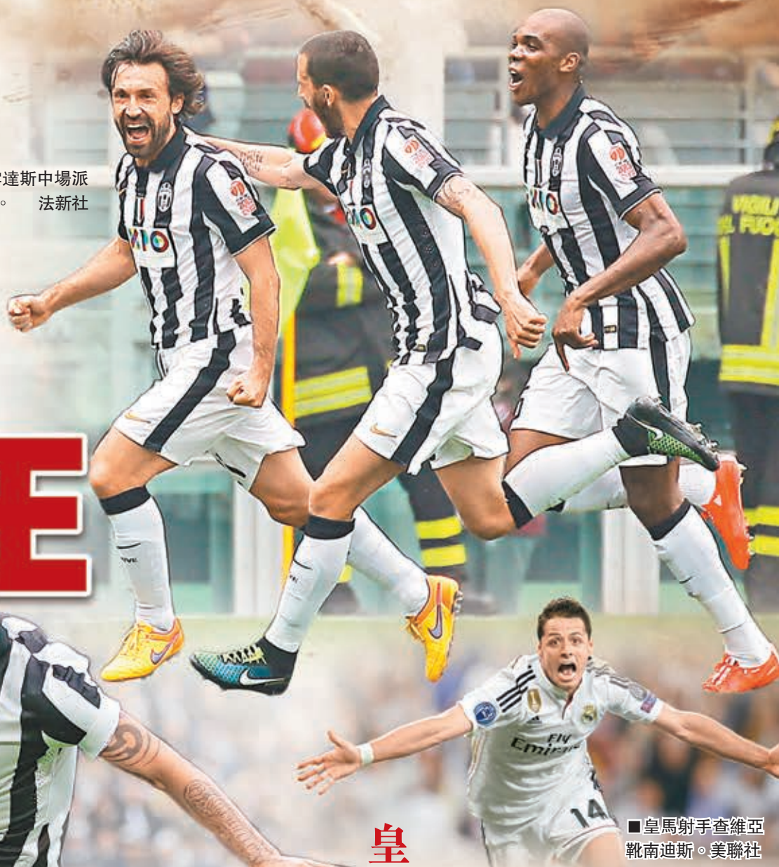
■皇馬射手查維亞靴南迪斯。