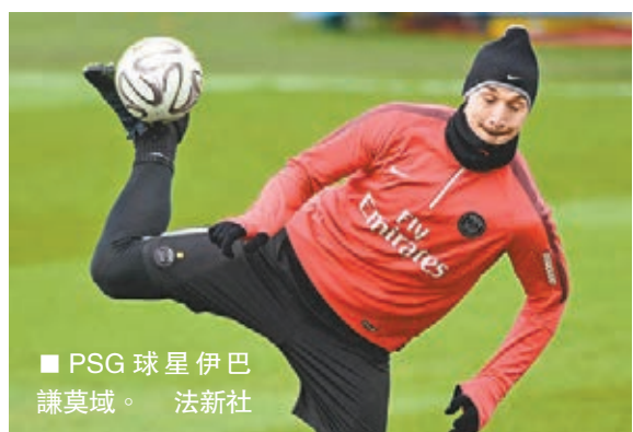
■PSG 球星伊巴謙莫域。

法甲巴黎聖日耳門（PSG）昨日表示，主帥白蘭斯、星將伊巴謙莫域、卡雲尼及柏斯托尼下季都會留隊。其中，對於有報道指英超曼聯或會斥資5,000