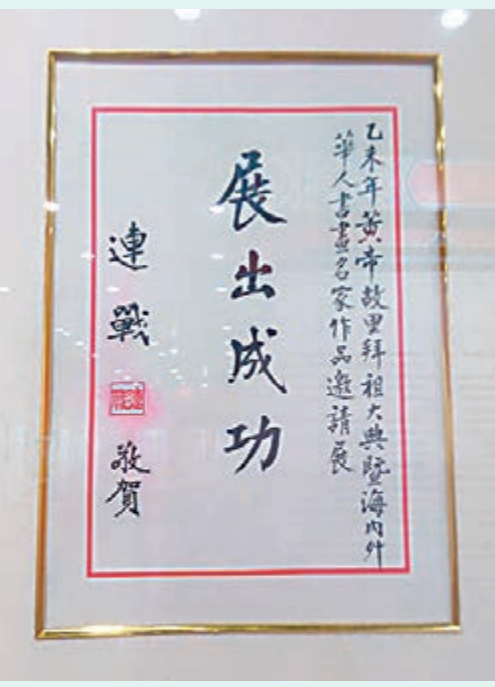
■中國國民黨榮譽主席連戰賀詞