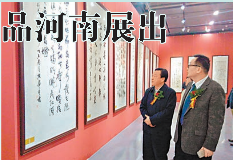
■書畫作品展吸引參觀者駐足欣賞

是次展出由河南省委宣傳部、河南省文聯、鄭州市政協、鄭州市委宣傳部主辦，河南省美術家協會、河南省書法家協會、鄭州市文聯、荊浩藝術研究院承辦。中國國民黨榮譽主席連戰先生、榮譽副主席蔣孝嚴先生為這次書畫展題詞。