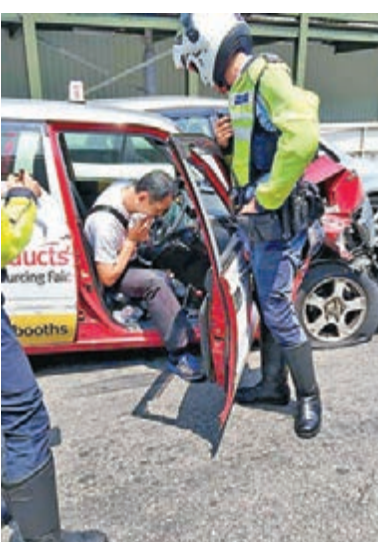
瘋狂駕駛的士司機最終在連撞8駕駛及無第三者保險下駕駛四車被捕。

香港文匯報訊（記者 杜法祖）一名被罰停牌的士司機，昨上午11時許駕車接載一名女乘客，沿青葵公路往新界方向行駛，途至貨櫃碼頭對開時，疑因高速遇上警方以鎗射槍影快相，在「中槍」後衝路障，載住女乘客瘋狂駕駛，被警方窮追3公里，至葵涌警署對開葵涌道遇上塞車，卻意圖撞開車輛突圍，結果釀9車相撞5人受傷，包括被捕的士司機。