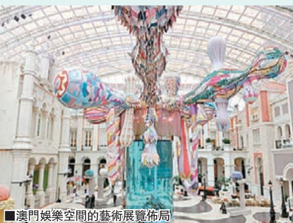
■澳門娛樂空間的藝術展覽佈局

2012年，當時的新光戲院作為本地粵劇文化的象徵，險些面對關門歇業的危機。文化與市場始終有一些