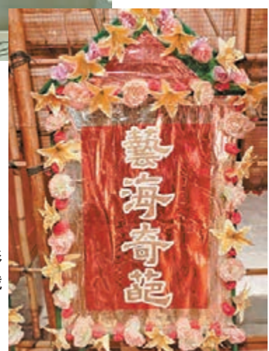
■藝海奇葩，彰顯本港民衆對戲曲文化的鍾愛