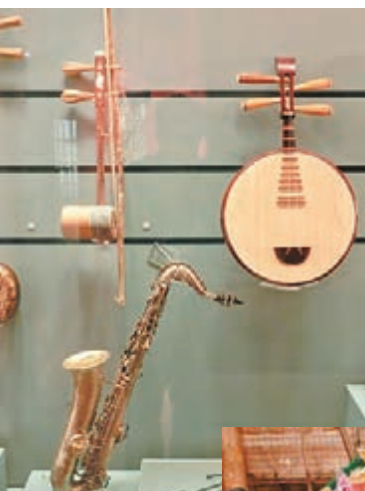
■粵劇表演中使用的樂器

展覽的解說詞，也與過往的敘明式解說文字有巨大不同。今次展覽的解說文字，更加類似於遊記、散文、詩歌或是回憶錄，沒有了冷冰冰的符號堆積，取而代之的是詩意一般的文化體驗和分享。