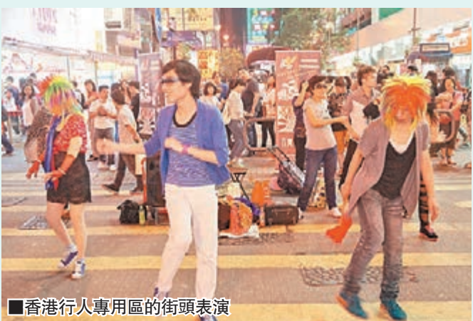
■香港行人專用區的街頭表演

外，演出形成的噪音也時常引起當區居民的反感。雖然2013年油尖旺區區議會通過了縮減行人專用區使用時數的決議，但是每逢雙休日或公眾假期，行人專用區的街頭表演依舊紅火，觀看人流也依然暢旺。在居民需要與表演文化之間，似乎大致取得了某種平衡。