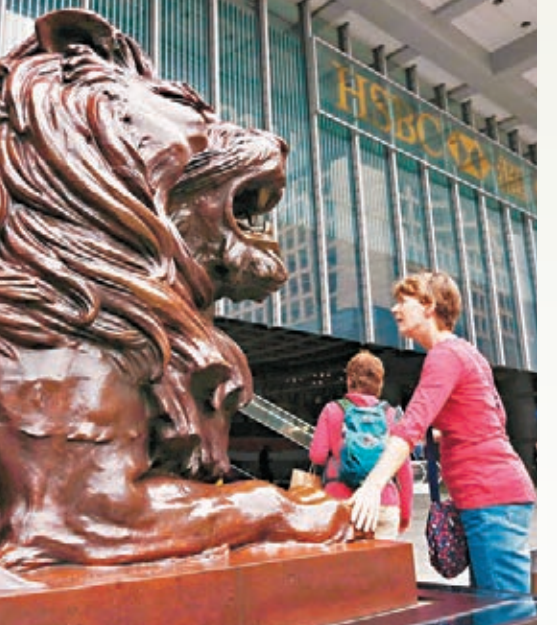
■沉寂已久的獅王匯豐控股，借啓動研究將總部搬離英國的消息，周五出現放量上衝...