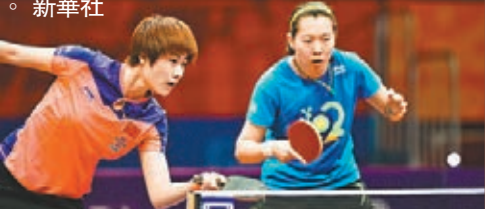
丁寧(左)和李曉霞在訓練中。

世乒賽周日在蘇州揭幕。中國男隊抓緊最後的分分秒秒在比賽場地進行適應性訓練。女隊主力李曉霞坦言，感覺壓力巨大，比賽還沒開始自己就已瘦了三斤。據網易體育消息，中國男乒昨晨率先到比賽副館訓練，主帥劉國梁表示：「這幾天會根據隊員情況，在運動量和對隊員的競技狀態調整等方面進行一定的安排。」劉國梁強調，希望隊員們保持平靜，讓自己進入一個簡單的備戰狀態。而中國女隊昨則與西班牙、瑞典兩隊同