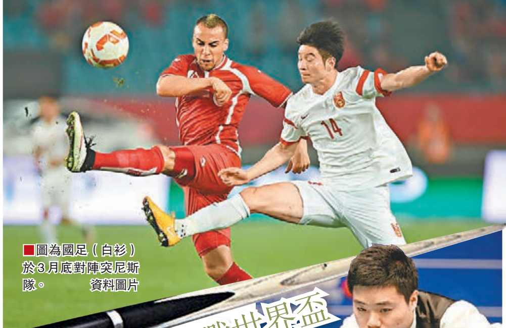
圖為國足(白衫)於3月底對陣突尼斯隊。 資料圖片