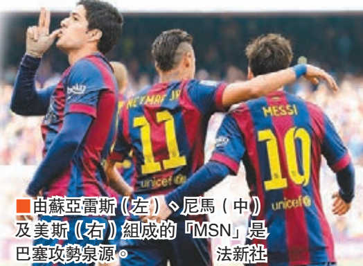
由蘇亞雷斯(左)、尼馬(中)及美斯(右)組成的「MSN」是巴塞攻勢源泉。

至於衛冕無望但應能保住第3名的馬德里體育會(馬體會)，今晚會迎戰來訪的艾爾切(now632台周六11:59p.m.直播)，對上3次馬體會都能贏對手2:0，領隊施蒙尼固然把握今次機會憑勝利挽回歐聯出局的低落士氣。 ■記者 鄭御龍