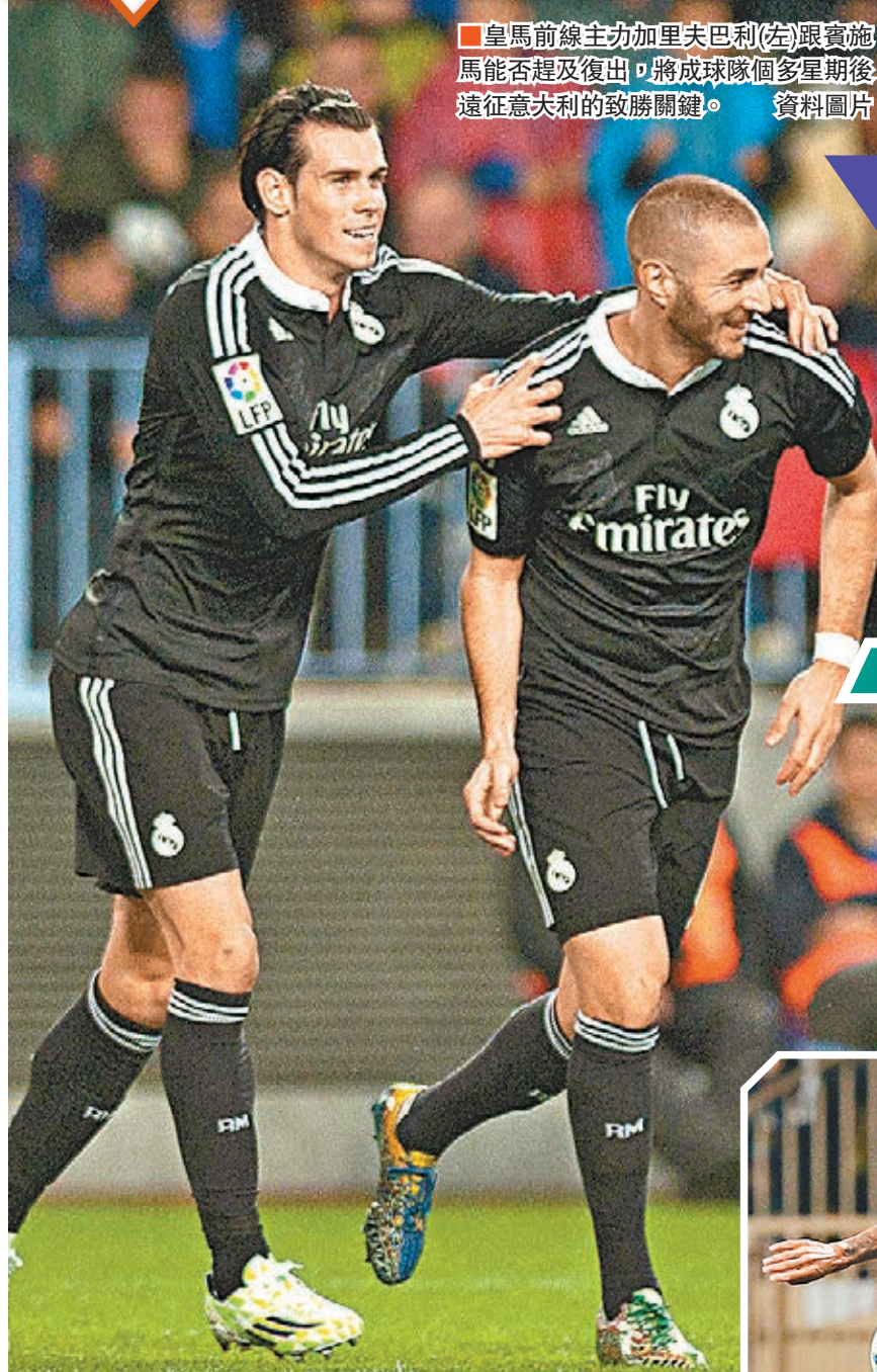
皇馬前線主力加里夫巴利(左)跟賓施馬能趕及復出，將成球隊個多星期後遠征意大利的致勝關鍵。