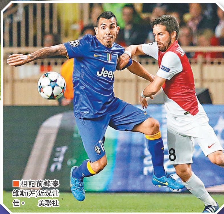
祖記前鋒泰維斯(左)近況甚佳。

至於另一場巴塞門拜仁，雙方的因緣除了拜仁領隊哥迪奧拿曾帶領巴塞多年外，兩軍亦在前年4強碰頭，最終正處換血期的巴塞在沒有哥帥下兩回合慘吞7蛋。到底拜仁能否重演2年前的大屠殺賽果，就要看其傷兵的康復進度和巴塞目前「MSN」進攻組合美斯、蘇亞雷斯和尼馬的化學作用有幾強大。 ■記者 鄭御龍