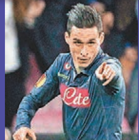
拿波里的荷西卡利祖昨晨再有「上哥」路透社

夫斯堡，並憑兩回合總比數6:3出線。「紫百合」在主場淨勝烏超的基輔戴拿模2球，總比數為3:1；西維爾則作客逼和俄超辛尼特2:2，總比數是4:3，但後衛巴里查卻因膝關節十字韌帶受傷而要休戰7個月。至於黑馬烏超的迪尼普則在臨完場前8分鐘轟入唯一入球，令兩回合以1:0淘汰比甲的布魯日躋身4強。 ■記者 鄭御龍