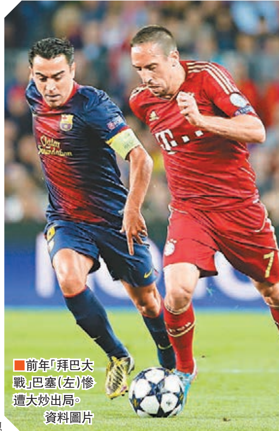
前年「拜巴大戰」巴塞(左)慘遭大炒出局。

決定今年歐洲冠軍的歐聯及歐霸盃4強對賽組合的抽籤，已於昨日定奪，上屆盟主皇家馬德里(皇馬)避開了兩大爭標熱門巴塞羅那(巴塞)與拜仁慕尼黑(拜仁)，個多星期後面對1998年的手下敗將祖雲達斯(祖記)。今次亦是皇馬領隊安察洛堤相隔多年後再對舊東家，從他對意大利足球的熟識程度加上對方近年欠缺歐戰經驗，皇馬要再入決賽可謂機會甚高。