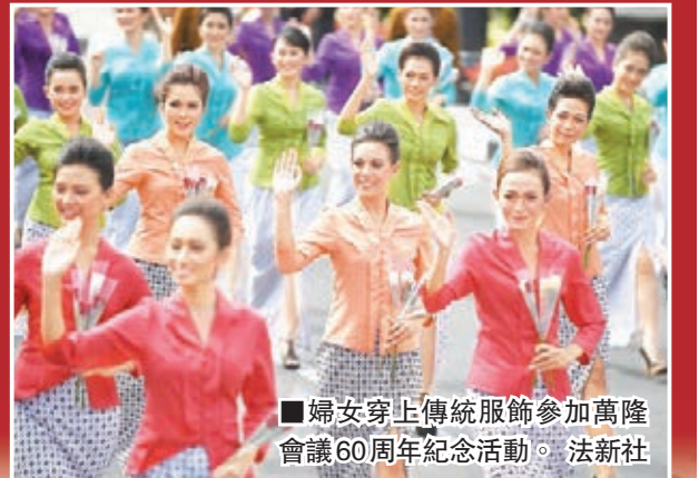
婦女穿上傳統服飾參加萬隆會議60周年紀念活動。

1955年4月18日至24日,亞非領導人會議在萬隆舉行,史稱萬隆會議。當年,29個亞非國家和地區的代表與會,是歷史上首次由亞非國家發起召開的國際會議。會議倡導的團結、友誼、合作的萬隆精神深入人心,達成的十項原則成為處理國際關係的重要準則。■新華社、中通社