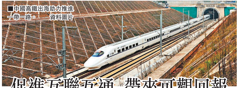
中國高鐵路出海助力推進「一帶一路」。