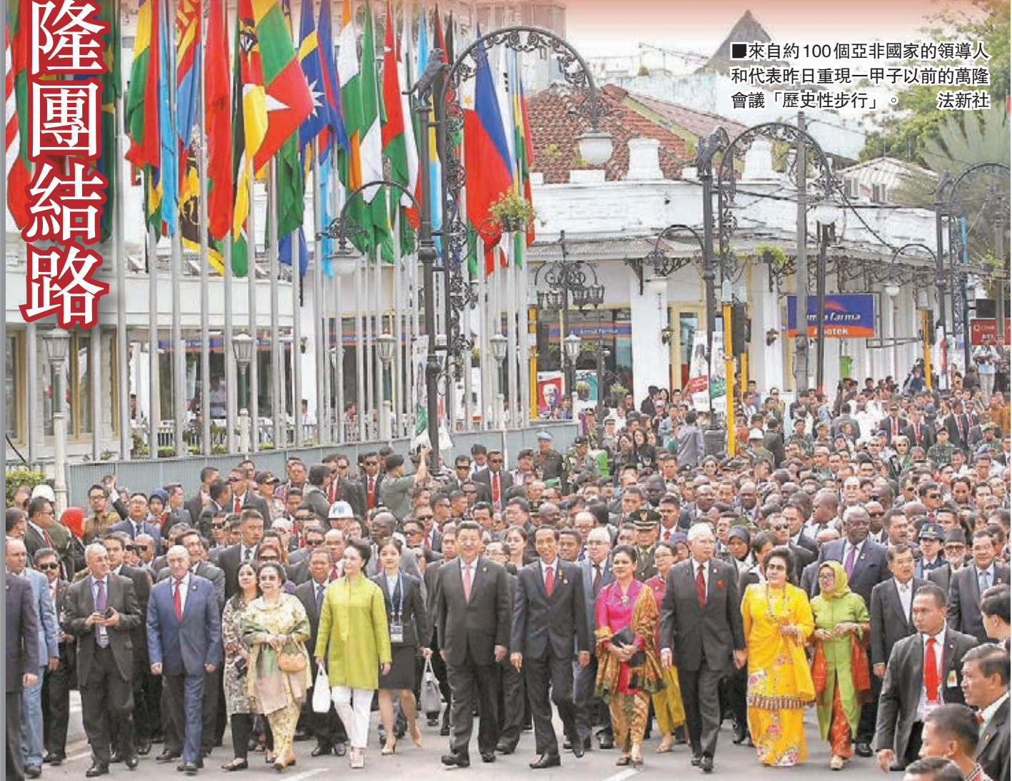
來自約100個亞非國家的領導人和代表昨日重現一甲子以前的萬隆會議「歷史性步行」。