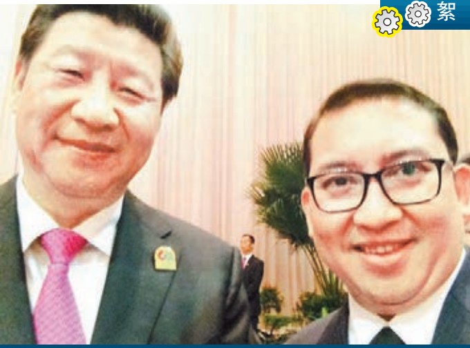
習近平與印尼當地官員的「自拍首秀」。網上圖片

4月22日,新浪微博「麗媛粉絲團」曬出兩張習近平與印尼當地官員的自拍合照,並配標題「(印尼)自拍首秀」。經鳳凰網核實,習近平旁邊的是大印尼行動黨副主席 Fadli Zon,照片是他在當地社交網絡上發佈的。網民對照片紛紛叫好,形容習近平可愛、親民。發稿前,轉發次數已超過2.7萬次。■新浪微博鳳凰網