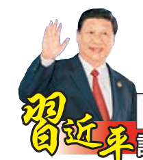
習近平訪巴國印尼

香港文匯報訊(記者海巖北京報道)作為中國最高國家領導人,習近平此次印尼雅加達之行親自擔任起中國高鐵路「推銷員」,為中國高鐵路出海「站台」。繼見證中國印尼簽署雅加達—萬隆高鐵路協議後,習近平在會晤伊朗總統魯哈尼時亦再次表達了擴大高鐵路合作的意向。有分析指出,在推進「一帶一路」戰略背景下,積極構建以本國為起點的高速鐵路網,向東南亞和中亞國家推介高鐵路,已成為中國「高鐵路外交」的一個重要課題。