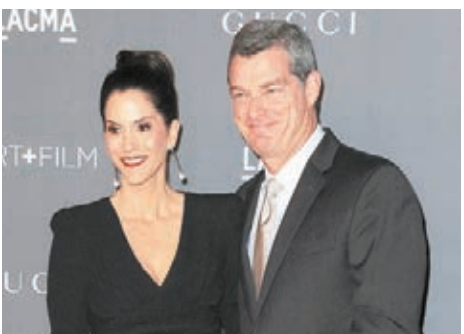
雷斯拿(右)以8.5億美元收購鷹隊。