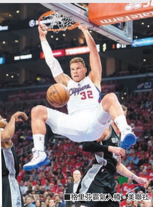
格里芬霸氣入樽。