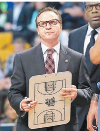
布魯克斯結束執教雷霆7年生涯。