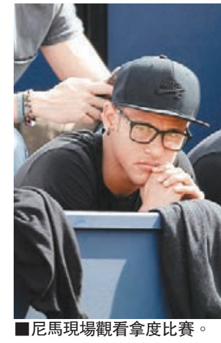
尼馬現場觀看拿度比賽。