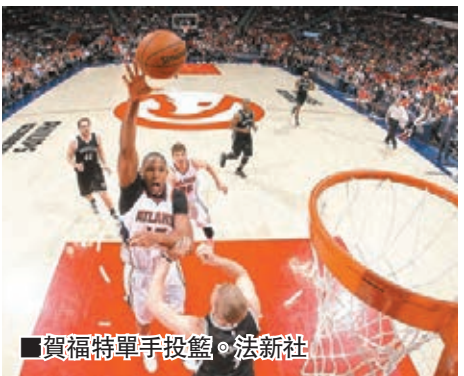
賀福特單手投籃。