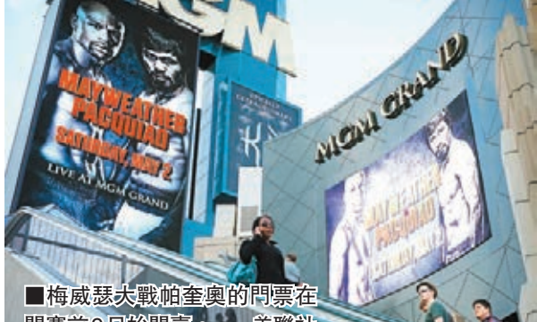
梅威瑟大戰帕奎奧的門票在開賽前9日開始開賣。