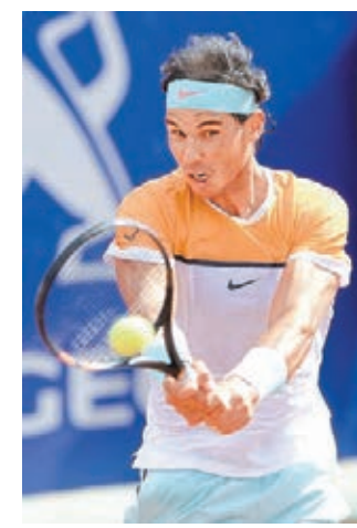
拿度淘汰艾馬高。

另外，力求衛冕冠軍的日本「一哥」錦織圭周四以6:2和6:1戰勝哥倫比亞的基拉度，晉級8強。