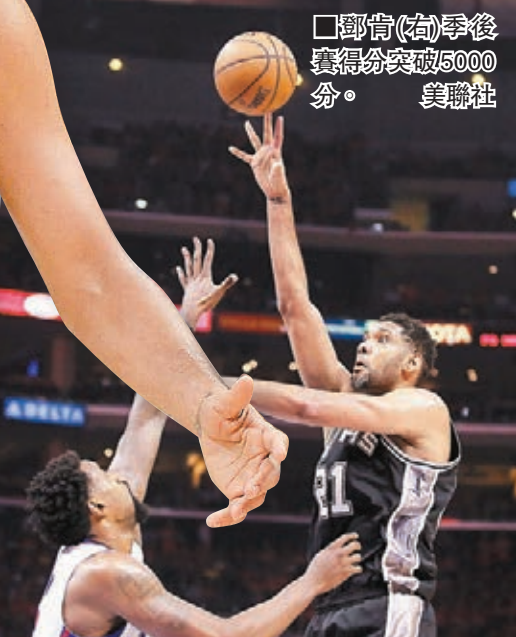
鄧肯(右)季後賽得分突破5000分。