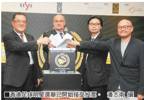
香港足球明星選舉已開始接受投票。

香港文匯報訊(記者 潘志南)「2014/15 Active O2 香港足球明星選舉」公眾投票昨晚正式展開，傑志和南華的粉絲已在網上競速投票。今屆公眾投票的比重增加至百分之五十，可見網上投票將更為激烈。