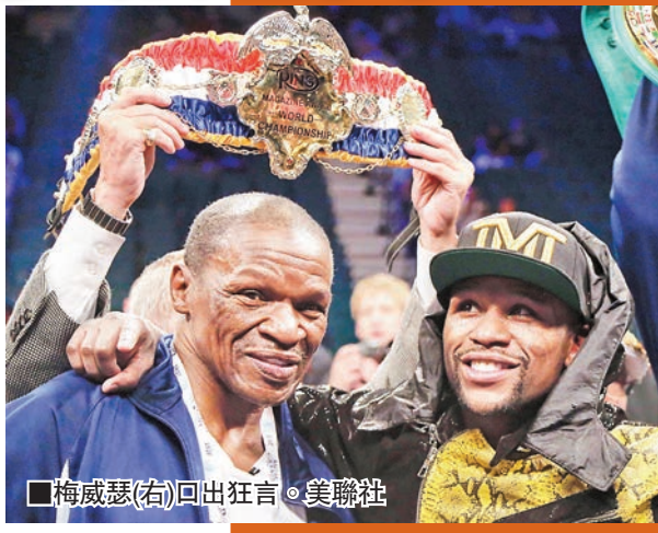
梅威瑟(右)口出狂言。