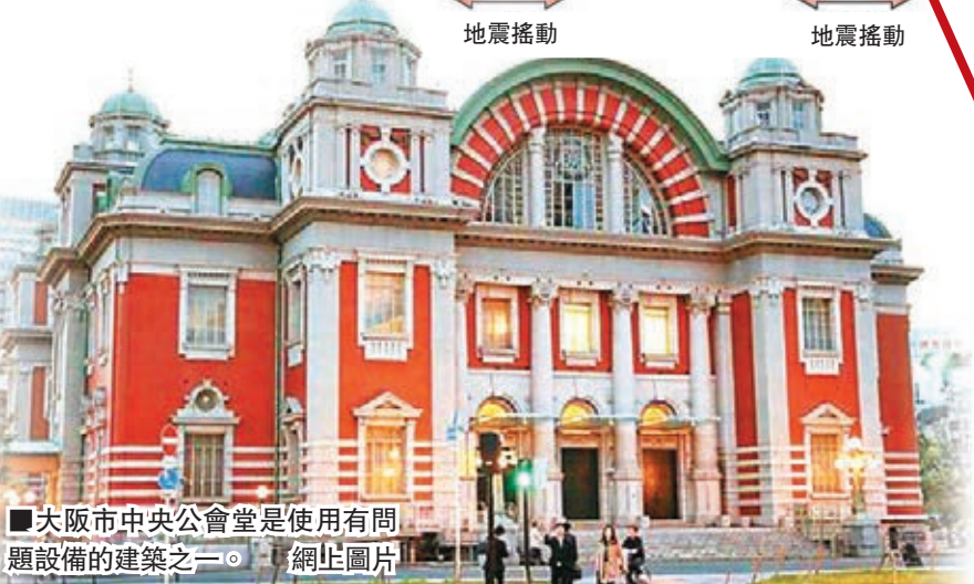
■大阪市中央公會堂是使用有問題設備的建築之一。網上圖片