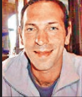
■另一名在空襲中喪命的意大利人質波爾托。網上圖片