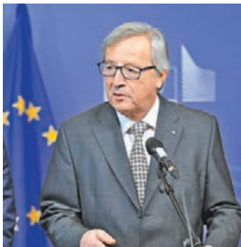
歐盟委員會主席容克不滿希臘債務談判進展緩慢。資料圖片