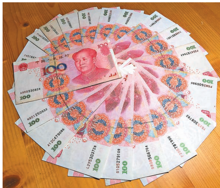
4月份以來本港多間銀行的一年期人民幣定息可高達4厘或以上。資料圖片

人民幣兼有高息、低波動的性質，吸引投資者吸納，人民幣存款規模日益壯大。據香港金管局發表的數據顯示，今年2月底止人民幣存款達9,730億元，按月減0.9%；而2014年底的人民幣存款則突破一萬億大關，按年增加16.6%。台灣那邊，3月底人民幣存款續創新高，散戶與法人合計達3,245.82億元人民幣。