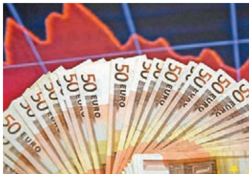
受希臘可能違約影響，歐元近日走勢轉弱。圖為歐元鈔票。

歐元兌美元周一下挫，因市場對希臘可能債務違約的擔憂加重。歐元兌美元延至周二低見至1.0660水平，受歐洲央行購債計劃以及希臘可能在數月內退出歐元的風險拖累。希臘周一緊急命令國有實體將閒置現金存放在央行，用於支付政府的賬單，涉及範圍從市政府到一支為未來幾代人準備的基金。希臘正同歐元區夥伴國以及國際貨幣基金組織(IMF)磋商改革計劃，以使後者同意發放剩餘救助資金。