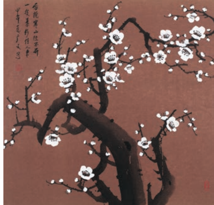
陳廣文作品《一枝素影待人來》。