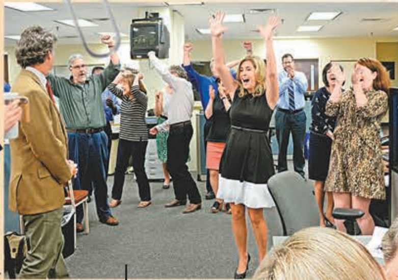
《信使郵報》員工得悉獲獎，開心到彈起。