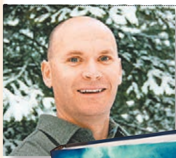
多爾的《我們看不見的光明》

美國小說家多爾憑著長篇二戰小說《我們看不見的光明》(All the Light We Cannot See)，奪得普立茲小說獎。該小說是去年暢銷作品之一，以失明法國女孩與年輕納粹士兵作主角，探討戰爭期間的生存、忍耐與道德困境。評審讚揚多爾「用簡潔、優雅的章節，探討人性與科技力量的矛盾」。 41歲的多爾花了逾10年時間創作，比二戰的時間還要長，他表示曾有一段時間想過自己永遠無法完成這部作品。聽到獲獎消息時，他正在巴黎與家人一起享用雪糕。 普立茲小說獎以往傾向頒給描述美國生活的作品，今次則罕有地頒給沒涉及美國人物的小說。 ■美聯社