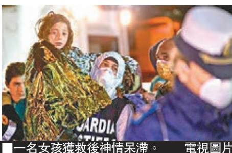
一名女孩獲救後神情呆滯。電視圖片

地中海近日接連有人蛇偷渡船沉沒，引起各方關注。意大利高級檢察官斯卡利亞警告，單是利比亞已有50萬至100萬人準備偷渡到歐洲。歐盟成員國外長前日在盧森堡開會，同意採取10點措施阻截偷渡潮，將於明日的歐盟特別峰會上討論。