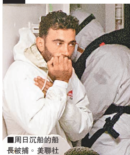
周日沉船的船長被捕。

地中海近日接連有人蛇偷渡船沉沒，引起各方關注。意大利高級檢察官斯卡利亞警告，單是利比亞已有50萬至100萬人準備偷渡到歐洲。歐盟成員國外長前日在盧森堡開會，同意採取10點措施阻截偷渡潮，將於明日的歐盟特別峰會上討論。