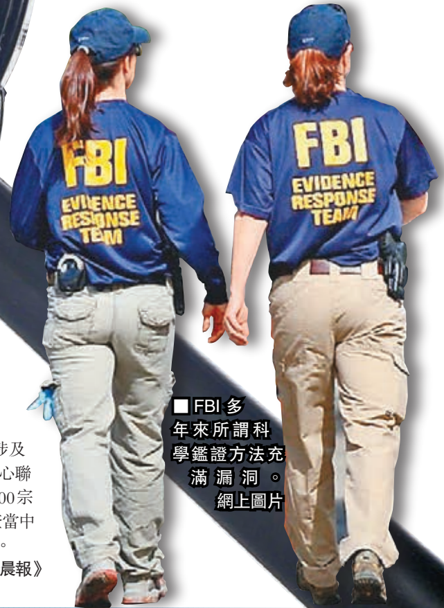
■FBI多年來所謂科學鑑證方法充滿漏洞。