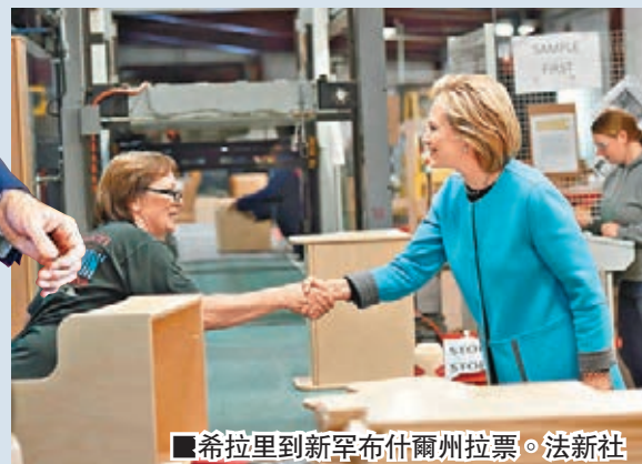
■希拉里到新罕布爾州拉票。法新社

美國前國務卿希拉里被視為民主黨總統提名人初選的大熱門，她的聲勢甚至嚇退不少有意參選者，令她