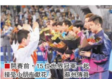
開賽前，15位世界冠軍一起接受小朋友獻花。

香港文匯報訊（記者 彭斌 蘇州報道）「常熟農商銀行盃」2015乒乓球世界冠軍大師賽19日晚在蘇州常熟開打，劉國梁、孔令輝、張繼科、馬琳、王勵勤、王皓、丁寧、薩姆索諾夫、佩爾森、柳承敏等15位國內外乒乓球世界冠軍齊聚一堂，展開了直橫拍大戰、四大滿貫挑戰、中韓對抗、趣味性表演賽等。