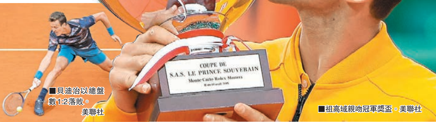
■貝迪治以總盤數1:2落敗。