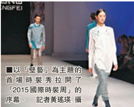
■以「壁藝」為主題的首場時裝秀拉開了「2015國際時裝周」的序幕。

香港文匯報訊（記者 黃瑤瑛 泉州報導）第十八屆海峽兩岸紡織服裝博覽會（下稱：海博會）、2015石獅國際時裝周近日在福建石獅舉行。今次國際時裝周主動融入泉州建設中國「海上絲綢之路」核心區的大佈局中，以「秀」為名，邀請意大利等「海絲之路」沿線國家、城市的設計師參與服裝發佈，促進新絲路服飾文化交流和深度合作。石獅是中國休閒服裝名城，也是中國紡織服裝生產基地，被稱為「東方米蘭」。其中，以「時尚石獅·設計新銳」為主題的2015盛大秀Party——「2015石獅國際時裝周」，安排有中國金頂設計師曾鳳飛、意大利設計師馬天尼、中國十佳設計師劉奕群等11場時裝秀，引起國際關注。