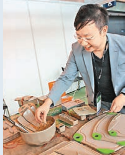
■來自新加坡的「Husks Green」首度參與展覽。