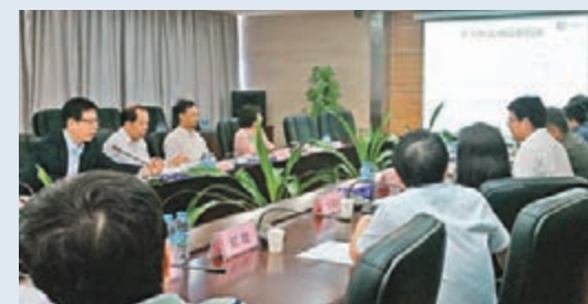
■梁挺雄到深圳出席傳染病防治工作座談會。

香港文匯報訊(記者 文森)夏天將至,又是蚊患的季節,市民應採取預防登革熱的措施。衛生署衛生防護中心總監梁挺雄昨日早上到深圳出席「廣東省和深圳市與香港特別行政區傳染病防治工作座談會」,討論今年登革熱和其他急性傳染病的預防和控制工作。梁挺雄返港後表示,本港鄰近地區的登革熱活躍程度一直高企,因此本港市民感染登革熱個案風險增加。