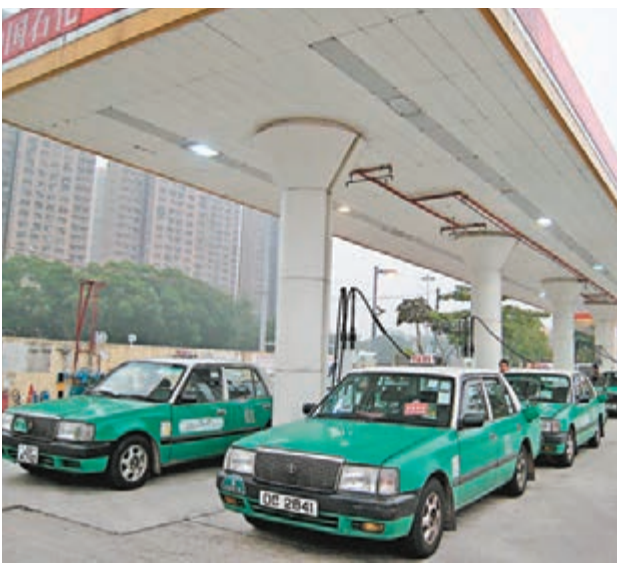
■新界的士申請落旗收21元。

立法會交通事務委員會副主席、工聯會立法會議員鄧家彪表示,由於近半年的油價及氣價下跌,令的士司機的收入改善及經營環境轉好,但不能排除維修費、泊車費及保費上升,令他們經營出現困難。鄧家彪指,任何加價對市民來說都是一種負擔,但需要平衡各方利益,他建議政府及業界應提出數據及文件證明的的士司機經營困難,有助市民及議員研究加價是否合理,否則難以作出評論。