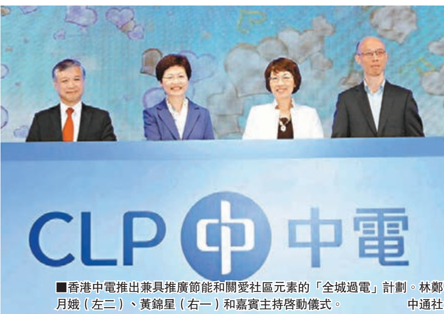
■香港中電推出兼具推廣節能和關愛社區元素的「全城過電」計劃。林鄭月娥(左二)、黃錦星(右一)和嘉賓主持啟動儀式。 中通社

阮蘇少涓續稱,外國有些地方開放電力市場後,由於監管模式不清,令投資者卻步,影響供電可靠性,以英國為例,預計今年的備用電量只有2%,遠低於20%至35%的合理水平,反映供電