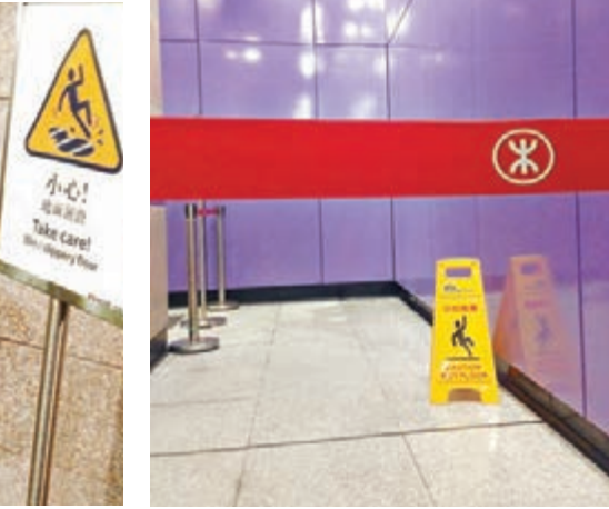
■西營盤站B出口放了「小心地滑」的標示，並圍起不准通過。