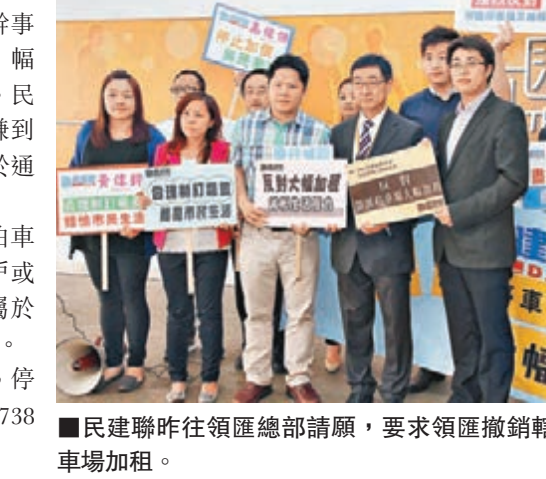
■民建聯昨往領匯總部請願，要求領匯撤銷轄下多個停車場加租。

香港文匯報訊（記者 聶曉輝）領匯轄下多個停車場將由下月1日起加租。民建聯10多名區議員及地區幹事昨日到領匯位於黃大仙的總部，抗議領匯大幅加租，幅度較去年7%至10%更高，部分停車場更高達15%。民建聯指出，儘管領匯是上市公司，但亦不應以「賺到盡」為目標，漠視基層市民的生活壓力，提出遠高於通脹的加幅，促請領匯撤銷加租。民建聯指出，現時領匯在全港擁有約78,000個泊車位，但絕大部分位於公共屋邨，故應以服務公屋租戶或居屋居民為主。然而，領匯停車場的客戶群大多屬於中、低收入的市民，對停車場租金升幅的承受力有限。民建聯又引述資料顯示，近年領匯停車場年年加價，停車位的月租已由2012年的1,338元上升至2014年的1,738元，3年間升幅高達30%，遠超同期物價上升的幅度。