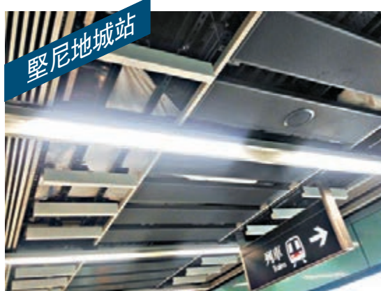
■B出口天花滴水，港鐵在假天花內設置大防水膠布盛載水滴。