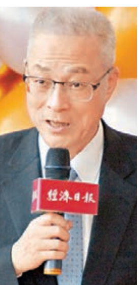
吳敦義對是否參選