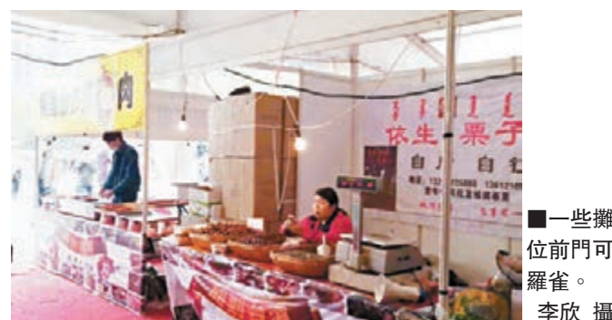
一些攤位前門可羅雀。

香港文匯報訊(記者 李欣 天津報導)自17日開始,一場為期五天的「天津社區直供商品展暨台灣特色美食匯」在天津舉辦。但由於其中的「台灣特色美食匯」與主辦方所宣傳的內容大相逕庭,致天津市民大失所望。 展銷分為兩個部分,設在戶外的大棚為「台灣特色美食匯」。本報記者在現場看到,大棚裡一共設有約20個攤位,而且其中並不全是「台灣美食」,也包括不少內地的特產,如新疆核桃、上海粗糧酥等等。即使是掛著「台灣美食」招牌的攤位,其經營者也多數是來自內地的商販。 對此,主辦方工作人員解釋說:「老闆基本都是台灣的。」昨天是星期日,也是「美食匯」開張的第三天,但來此光顧的市民遠不像主辦方所宣傳的那樣踴躍。他們大多是附近休閒的居民或是過路的看客,有些購買並品嚐了「台灣美食」的客人對「美食」的評價也是褒貶不一。一位偏愛台灣小吃的女士對記者說:「我以前也到過幾次台灣美食展,味道比這次正宗多了。」記者在網上看到,關於這次「台灣美食展」,網友的評論充滿了質疑,有的則更加直白:「又騙人來了」、「跟台灣一毛錢關係都沒有」等等。