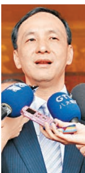
朱立倫日前稱不會參選

香港文匯報訊 中國國民黨2016年「大選」提名作業和黨員連署今天(20日)開始領表,黨內目前唯有「立法院」副院長洪秀柱表態參選,她強調「第一天就要去領表」,洪秀柱號召支持者站出來,今天上午陪同一起前往國民黨中央黨部領表。此外,國民黨主席朱立倫、「立法院長」王金平、副「總統」吳敦義等人動向也備受矚目。國民黨去年底地方選舉遭遇挫敗,新北市長朱立倫就任黨主席後,欲力挽頹勢。2016年「大選」對國民黨而言將是一場硬仗,連帶影響「立委」選舉。