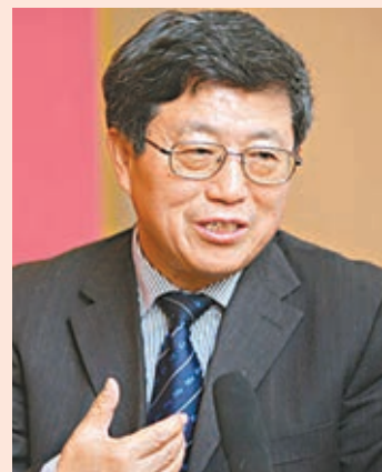
全國政協委員、中國(海南)改革發展研究院院長遲福林。本報河北傳真

上海自由貿易試驗區也是採用此種模式。國外負面清單範圍明顯少於中國。2013版上海自貿區負面清單幅度達到190項，2014版減少至139項。以製造業為例，發達國家一般製造業的限制不超過10項，上海自貿區的負面清單裡製造業限制仍有60多項。