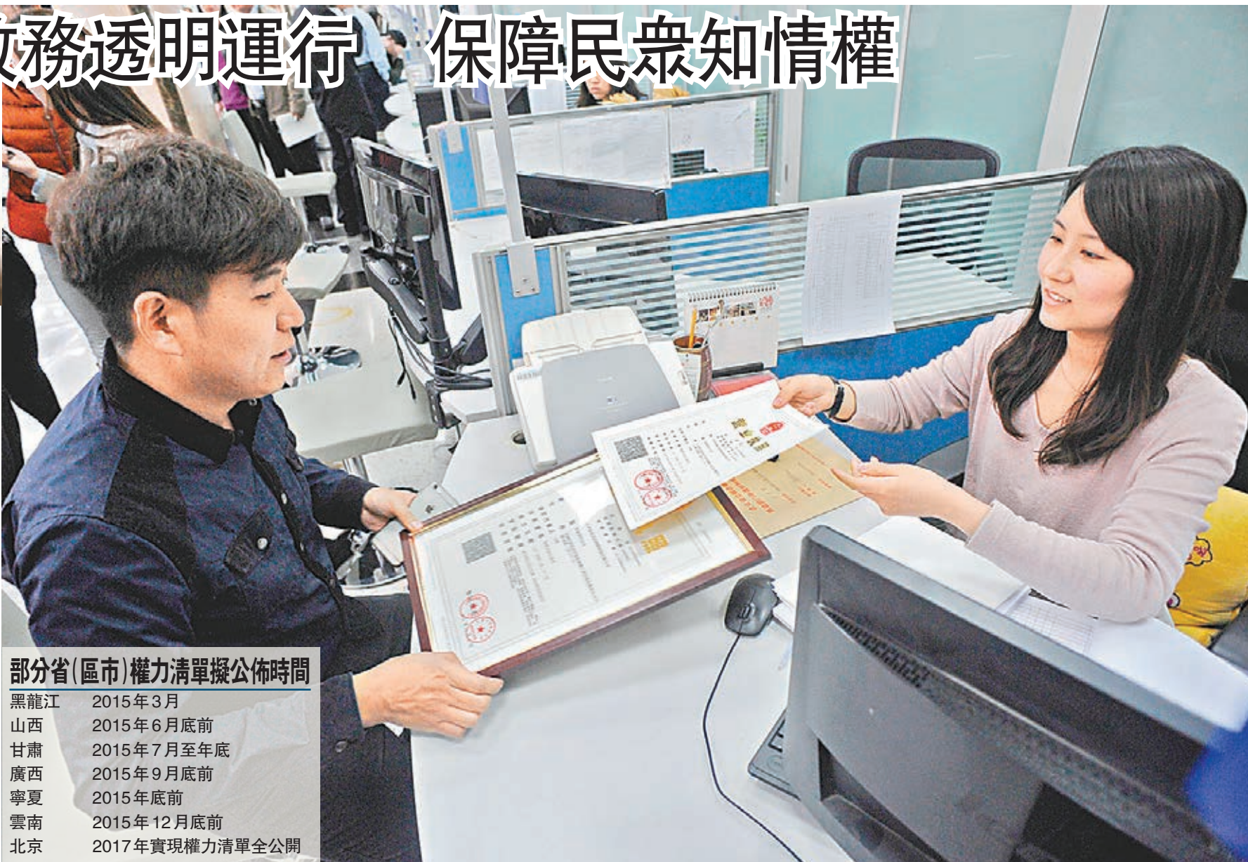
各地將陸續公布權力清單，非行政許可事項將全面取消。圖為天津3月份實施營業執照「三證合一」登記制度，加大簡政放權力度。