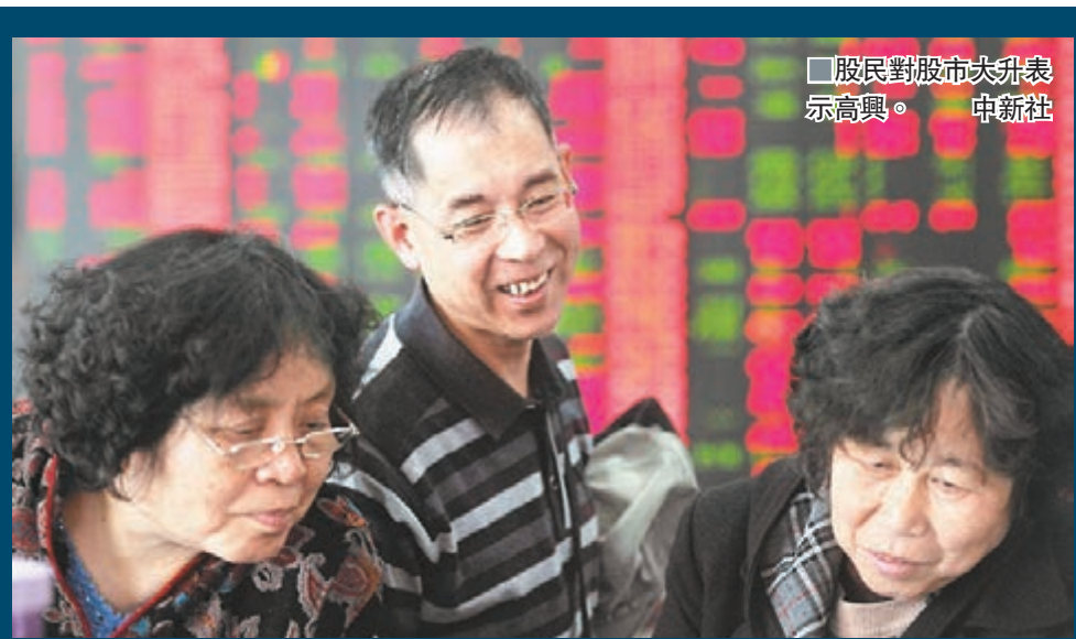
■股民對股市大升表示高興。

由於市場火爆,融資業務似有再收緊之苗頭。鄧舸透露,證監會主席助理張育軍近日在券商融資業務通報會上對兩融業務提出七項要求,強調要科學合理謹慎設置融資規模,加強兩融業務風險管理,及時調整初始保證金比例、標的證券範圍,並要求券商做兩融業務不得開展場外配资、傘形信託等活動。目前,滬深兩市融資餘額已突破1.7萬億元大關。