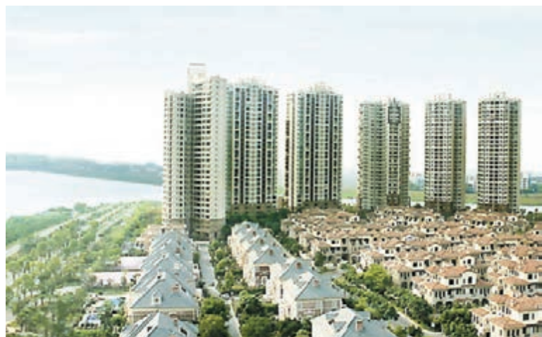
■佛山在去年放鬆限購的基礎上,擬再推出措施救市。 資料圖片

香港文匯報訊(記者 古寧 廣州報道) 「3.30樓市新政」推出後,多個地方政府開始加速推出利好政策刺激樓市,從金融、公積金、稅費等不同程度給予支持。佛山傳即將推出相關救市措施,佛山市政府擬推出的《關於保持經濟穩定增長的若干意見》等文件中提及,將全面取消佛山區域住房限購政策,購買90平米普通住房作為家庭唯一住房,其契稅減按1%徵收。