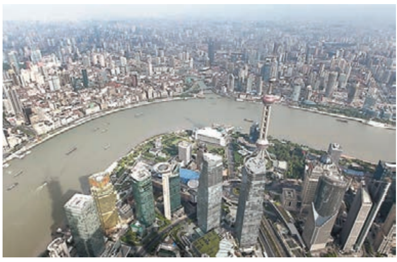
■浦東新區金融業增加值佔地區生產總值比重高達21%。

最新數據顯示,截至2014年底,浦東聚集了844家監管類金融機構,金融業增加值逾千億。除此以外,浦東亦是全球總部經濟高地,共匯聚了372家總部,並有192家外資研發中心,是跨國公司在華設立國際研發公司最集中的區域。