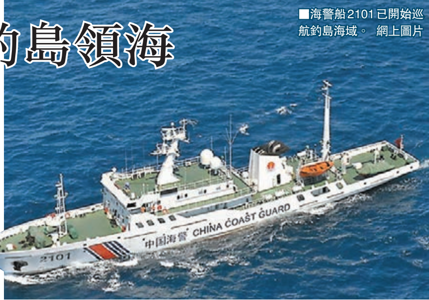
■海警船2101已開始巡航釣島海域。

據國家海洋局發佈的《中國海洋發展報告》研判，日本右傾化導致中日海上對抗加劇，是影響中國海洋安全的重要問題。