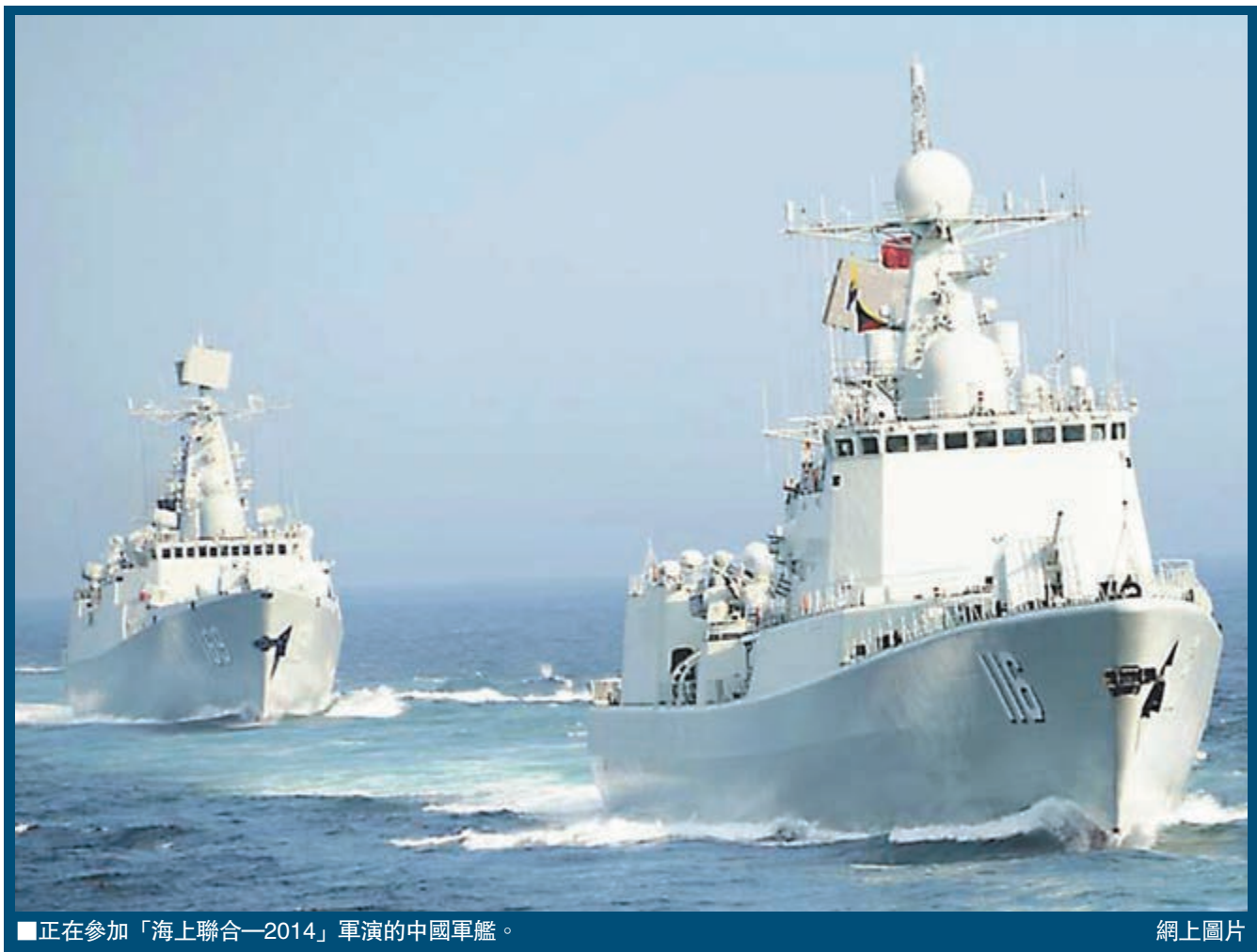
■正在參加「海上聯合—2014」軍演的中國軍艦。