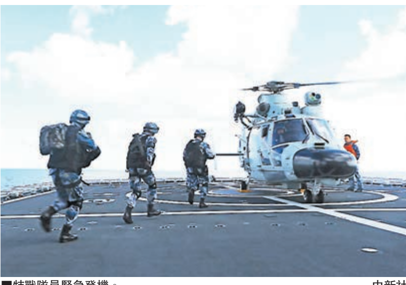
■特戰隊員緊急登機。