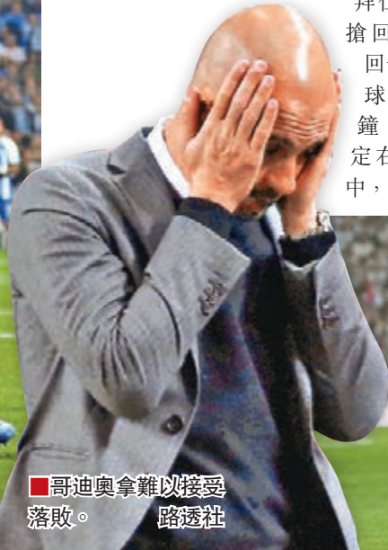
哥迪奧拿難以接受落敗。