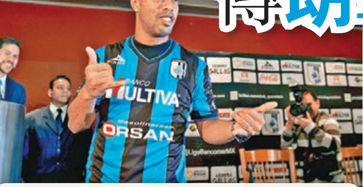
「細哨」去年加盟墨西哥球會。

據巴西傳媒報道，曾兩奪「世界足球先生」的巴西球星朗拿甸奴(細哨)計劃在下月本球季墨西哥聯賽結束後宣布掛靴。