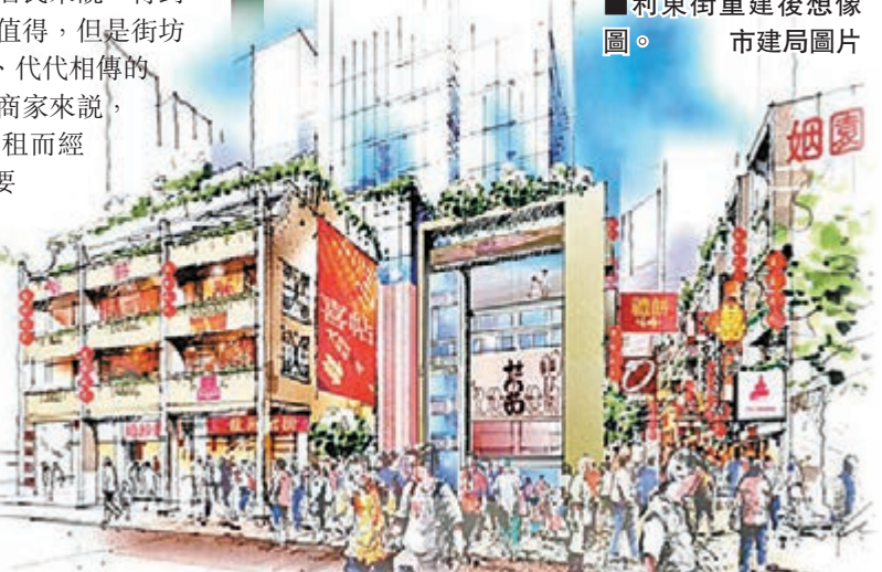
利東街重建後想像圖。

虧蝕；事實上，就算經濟景氣的時候，市建局也不可能同時進行太多項目。以這種速度進行，市區重建的進度當然緩慢。所以，市建局真正需要檢討的，不只是需求主導重建計劃，而是整個市區重建的注資模式，特別是自負盈虧的運作模式。