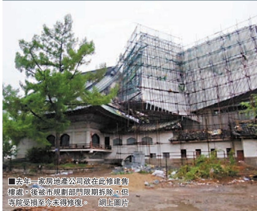
■去年一家房地產公司欲在此修建樓宇,後被市規劃部門限期拆除,但寺院受損至今未得修復。網上圖片

香港文匯報訊(實習記者 張睿航 吉林報道)據當地媒體消息,作為日本侵華罪證的吉林長春東本願寺舊址遭到房地產公司連建破壞一年有餘,受損寺院尚未得到維修。目前,長春市文物局正與涉事房地產公司溝通寺院修復問題。有專家呼籲,長春東本願寺是日本侵華罪證,具有警示作用,應盡快予以修繕。