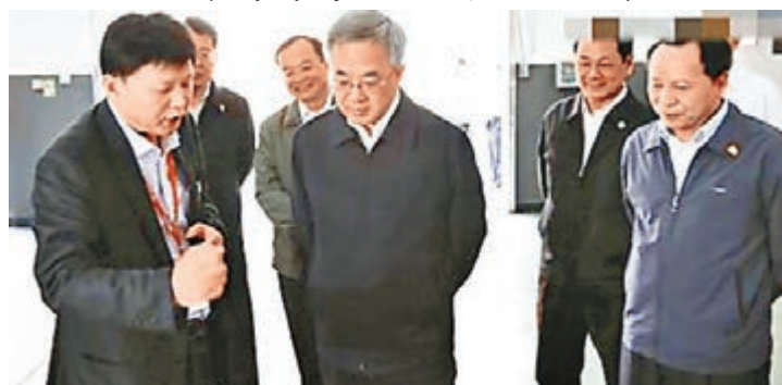
胡春華到東莞高新技術企業參觀。