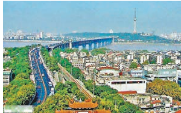
湖北武漢長江大橋。