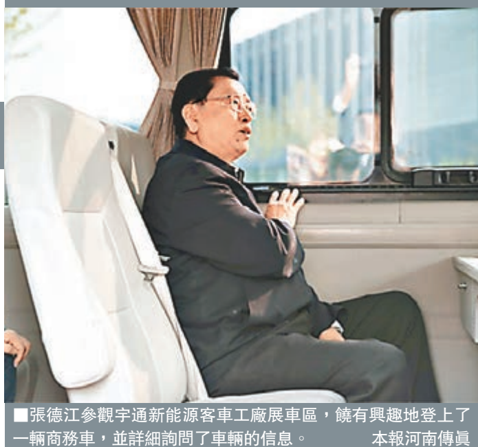
張德江參觀宇通新能源客車工廠展車區, 饒有興趣地登上了一輛商務車, 並詳細詢問了車輛的信息。