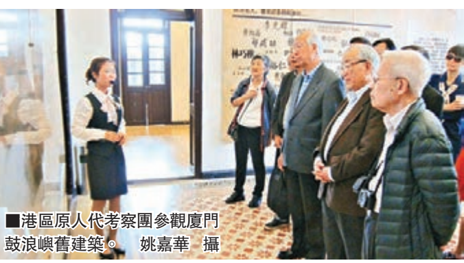
港區原人代考察團參觀廈門鼓浪嶼舊建築。

香港中文大學中醫藥研究所臨床研究中心所長、第九屆至第十一屆全國人大代表梁秉中表示此行受益良多。他看見國家為準備兩岸同胞未來共同發展，在平潭綜合實驗區內積極改善兩岸的交通往來。在泉州參觀多個博物館，也令他了解到國家在過去千百年來都是對不同國家、民族予以包容。