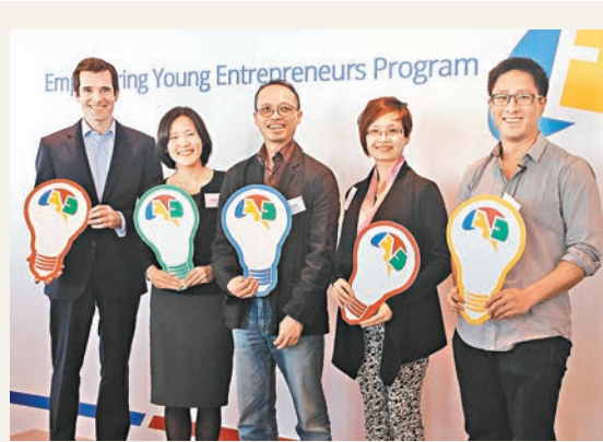
「EYE年輕創業家計劃」望為香港新增33.9萬個職位,帶動本地GDP增長。

悉數兌換後將升至54.6%)。天貓平台現時有186家有互聯網藥品交易服務資格的藥房銷售非處方藥、醫療器械、隱形眼鏡和其他保健產品。截至今年3月底止財年,天貓在線醫藥業務的總商品交易額約47.4億元(人民幣,下同)。 中國醫療健康行業的更多參與方。阿里健康將成為阿里巴巴醫療健康領域的旗艦平台。截至2015年3月31日止年度,天貓在線醫藥業務的收入為1.03億元,按年增長77.7%;純利7,088.6萬元,增長61.2%。 阿里健康股價復牌後狂飆,較去年賣殼時的0.5元抽升逾23倍。第一上海證券首席策略師葉尚志向本報表示,阿里系股份再成市場焦點,阿里健康雖已升近八成,惟仍看好後市,股民可追入。