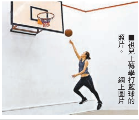
祖兒上商台宣傳新碟。祖兒上場打籃球的照片。網上圖片