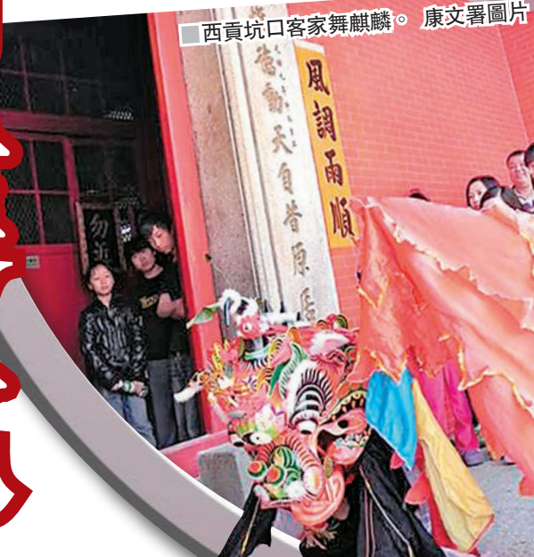
西貢坑口客家舞麒麟。