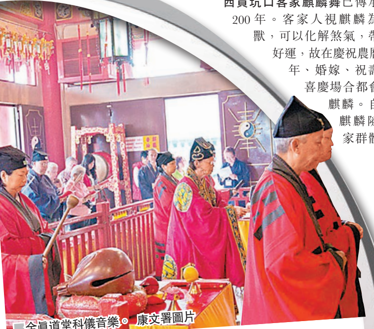
全真道堂科儀音樂。