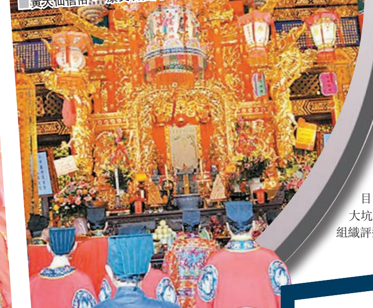
黃大仙信俗。