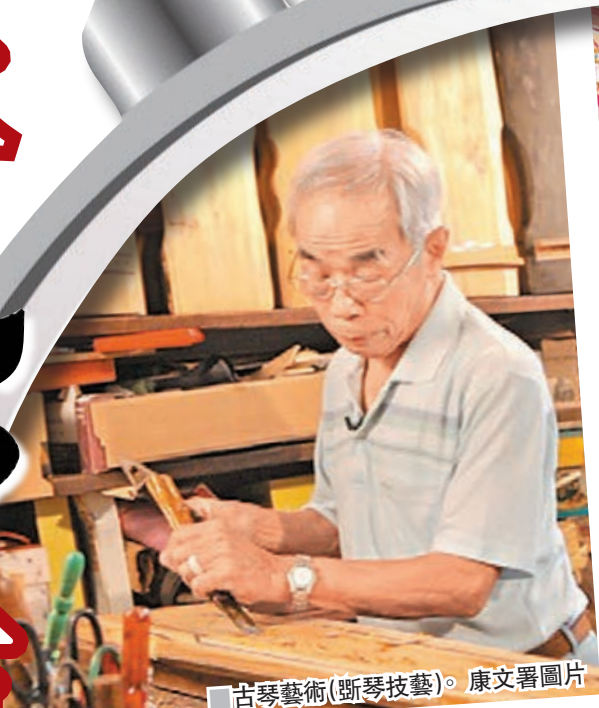
古琴藝術(斲琴技藝)。

西貢坑口客家舞麒麟已傳承逾200年。客家人視麒麟為瑞獸，可以化解煞氣，帶來好運，故在慶祝農曆新年、婚嫁、祝壽等喜慶場合都會舞麒麟。自舞麒麟隨客家群體移