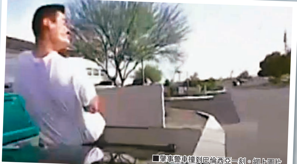
肇事警車撞向巴倫西亞一刻。