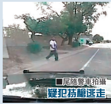
尾隨警車拍攝 疑犯持槍逃走