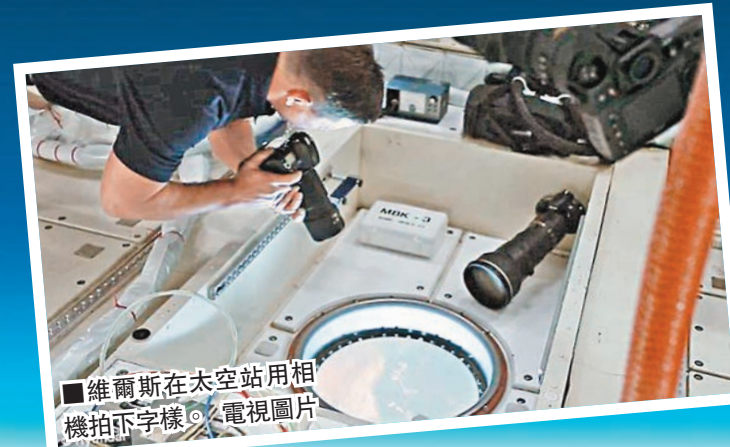
維爾斯在太空站用相機拍下字樣。電視圖片

按照設計，「獵鷹9號」與「龍」飛船分離後，會再次點火並調整姿態返回大氣層，在導航系統協助下垂直降落在海中一個只有足球場大小的浮動回收平台上。雖然火箭準確到達降落地點，但著陸力度過大，相信難以再用。 ■美聯社/法新社