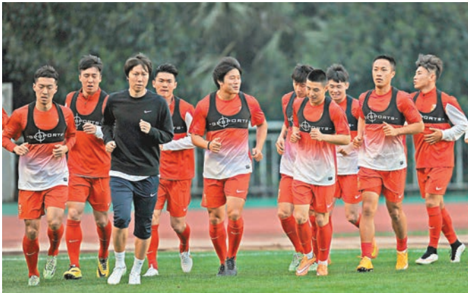
國足上月在長沙集結備戰熱身賽。資料圖片