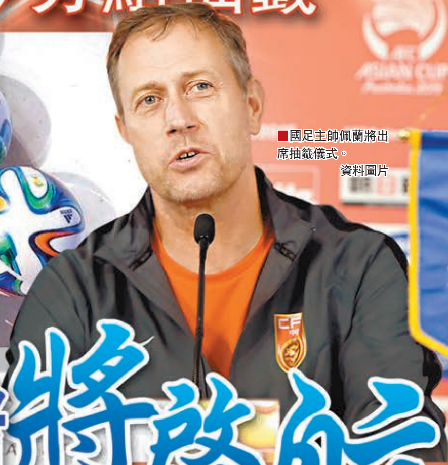
國足主帥佩蘭將出席抽籤儀式。資料圖片