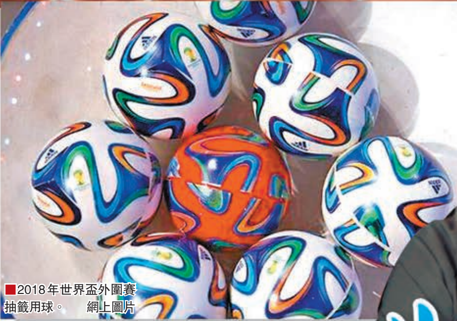
2018年世界盃外圍賽抽籤用球。

2018年俄羅斯世界盃亞洲區外圍賽第二階段分組抽籤，今天下午在馬來西亞首都吉隆坡進行。中國男足（國足）將以種子身份參加抽籤，主帥佩蘭在接受國際足協官網訪問時表示：國足獲得種子球隊資格固然可喜，但更重要的是中國隊已經做好了衝擊2018年俄羅斯世界盃的準備。