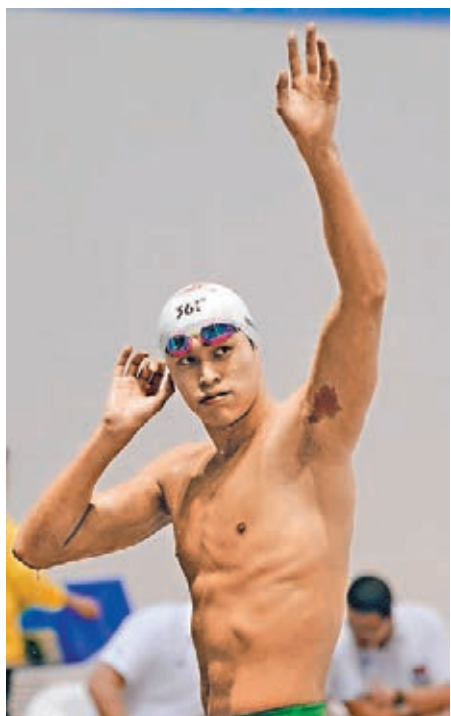
孫楊賽後向觀眾致謝。

「小鮮肉」寧澤濤的首秀贏得追捧，孫楊則繼續其在本次賽事上的「大包大攬」。在男子800米自由泳的比賽中，孫楊的出場贏得了不亞於寧澤濤的掌聲，而他也用精彩表現回報了觀眾。不同於之前比賽的早早取得領先，本場入水後的孫楊受到臨道選手王柯成的強力挑戰，兩人一直纏鬥到450米時孫楊才甩開對手，並在600米時拉開一個身位，最終以7分47秒58奪下本次賽事第三枚金牌。