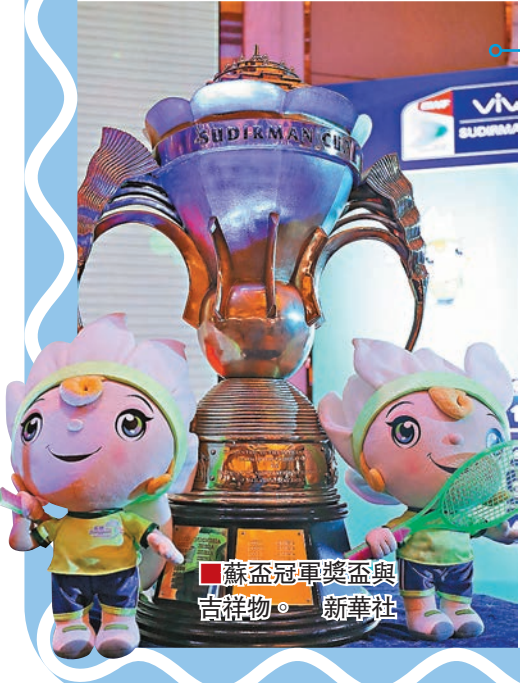
蘇盃冠軍獎盃與吉祥物。新華社