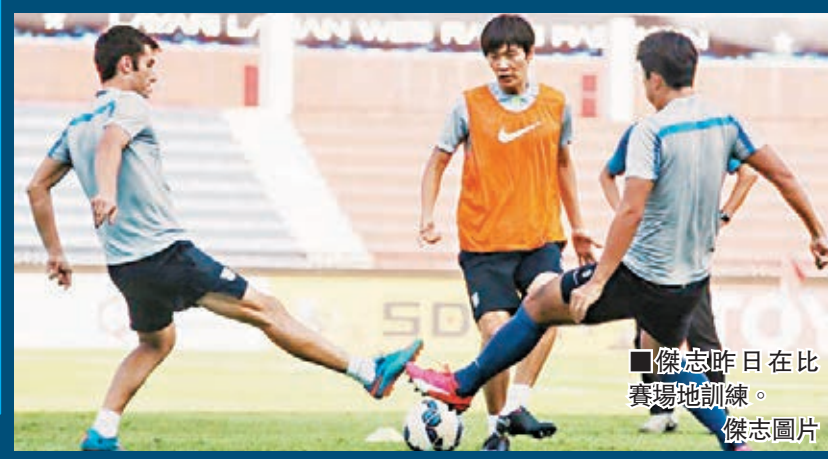
傑志昨日在比賽場地訓練。