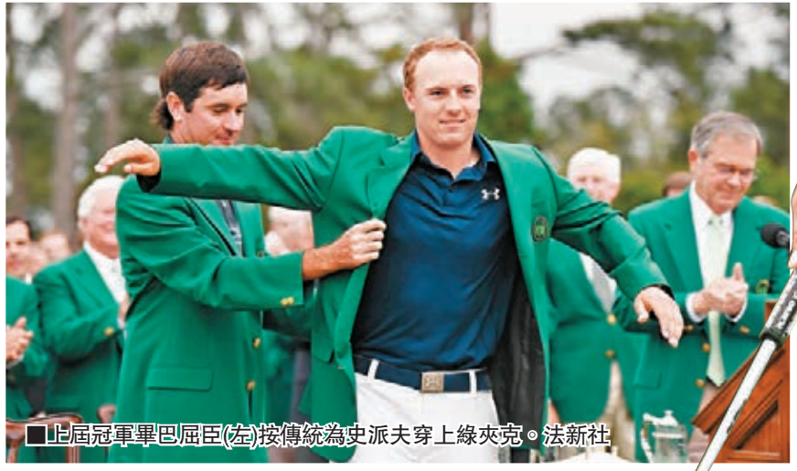
上屆冠軍畢巴屈臣(左)接傳統為史派夫穿上綠夾克。

年僅21歲的美國高爾夫球新星史派夫在美國大師賽毫無敵手，連續4輪一直領先，最終在周日以總成績低標準杆18杆的270杆，壓倒2013年冠軍路斯和3屆冠軍米基遜，贏得個人職業生涯首項大滿貫錦標，穿上象徵冠軍的「綠夾克」，獲得高達180萬美元冠軍獎金，並在大師賽多項紀錄留名。