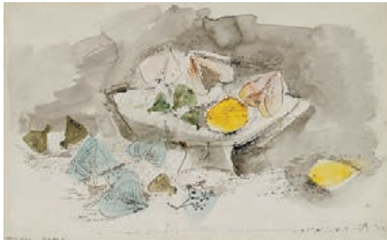
■Nature Morte, 1953.

此前於德薩畫廊展出為期一個月的《趙無極：水墨水彩》展覽，是中國著名藝術家趙無極（1920-2013）的重要個展。在展覽中，我們看到了14件水墨和6件水彩作品，創作年份最早則是1950年。這些作品代表着第二次世界大戰後中西藝術的融合，也標誌着中國傳統水墨藝術的變奏。繼2011年《趙無極五十、六十年代作品展》後，這是德薩畫廊第二次舉辦趙無極個展。