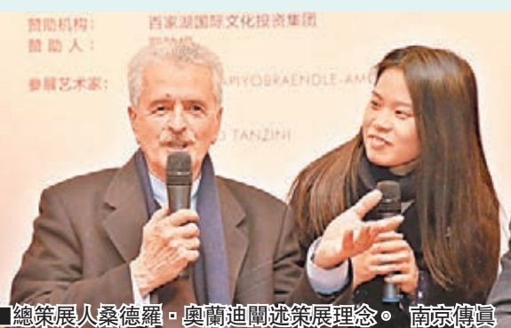
■總策展人桑德羅·奧蘭迪闡述策展理念。南京傳真

此次肯尼亞國家館的展覽邀請了5位中國藝術家及一家藝術中心與肯尼亞藝術家一起參展，總策展人桑德羅·奧蘭迪先生表示，本屆威尼斯雙年展肯尼亞國家館的展覽主題為「創造身份」，當今社會個人主義比較盛行，反思人之存在和人的外在與內心的關聯，是個性藝術家一個孜孜以求的目標。此次肯尼亞國家館的展覽主題定為「創造身份」，就是希望通過參展藝術家的作品，從哲學、藝術等方面反思人的存在，探討隱藏在面具之下最本質的東西。策展團隊從中國邀請的這5位藝術家和一家藝術機構，他們的創作融合了新思維、新現象、新的藝術語言，表達身份轉換的身體含義，反思文明衝突和人與世界的本質關係，非常符