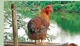
■熱銷的清遠雞需要等半年才能吃上。本報廣州傳真

香港文匯報訊(記者胡若璋廣州報道)去年「雙11」,一則「一天賣掉上千萬隻清遠雞」的新聞搶登內地各大網站頭條。如今,5個月過去了,廣東清遠這家公司的857萬隻清遠雞,至今卻還有近7成沒有交付。