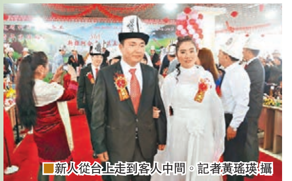
■新人從台走到客人中間。

香港文匯報訊(記者黃瑤瑛泉州報道)「千里姻緣一線牽」,11對來自新疆柯爾克孜族的務工青年在福建晉江一家公司的員工食堂裡舉行集體婚禮。這家公司裡,有340名來自新疆阿奇庫勒的柯爾克孜族人。