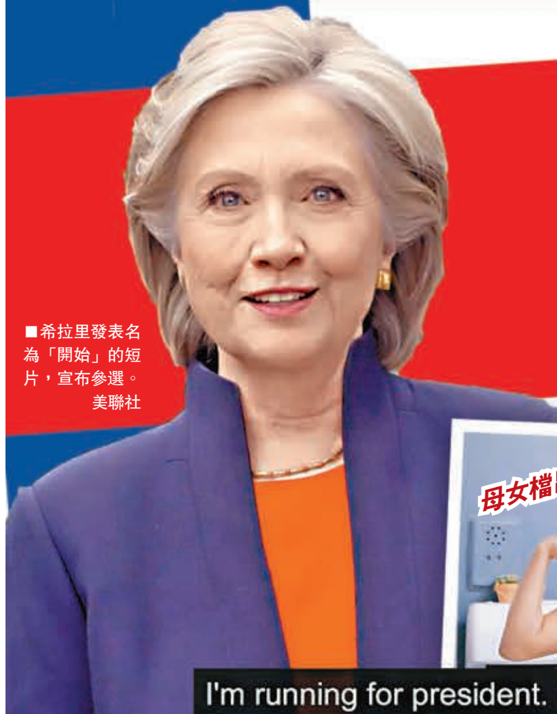
■希拉里發表名為「開始」的短片，宣布參選。

千呼萬喚始出來！經過近兩年來不絕於耳的傳聞後，美國前國務卿希拉里前日正式宣布參加明年總統大選，她在互聯網發表名為「開始」的短片，形容自己希望成為美國人的鬥士。希拉里外交經驗豐富，分析指，她任國務卿時曾推動「重返亞太」戰略，意味若她執政，美國可能更深入介入亞洲事務，並加強與中國的接觸。