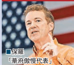
■保羅「華府傲慢代表」