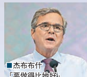
■杰布布什「要做得比她好」