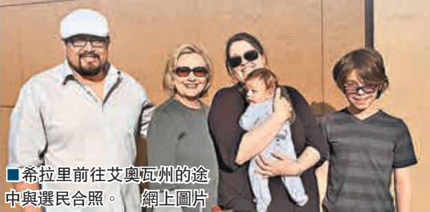
■希拉里前往艾奧瓦州的途中與選民合照。