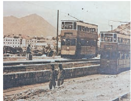
電車行駛過高士威道