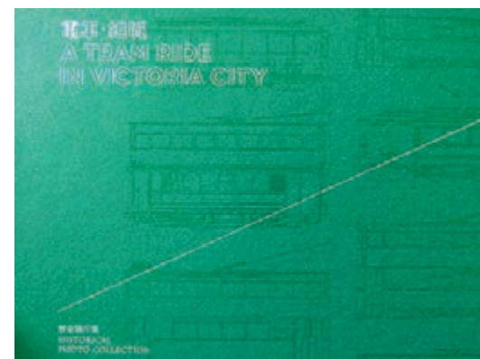
為今次展覽而製作的圖集