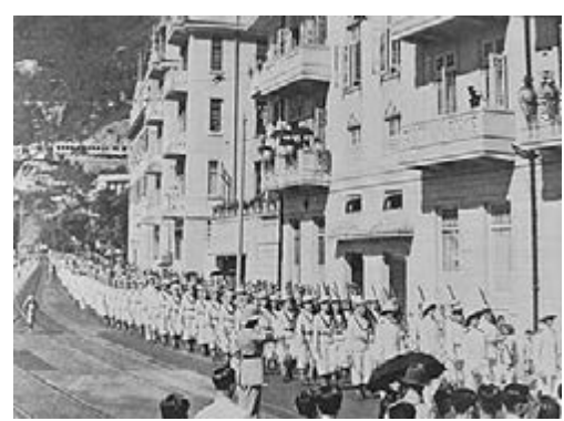
舊時跑馬地的路軌