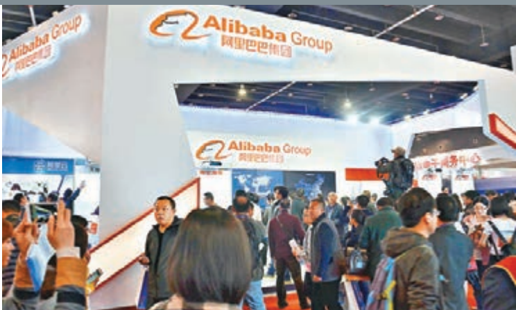
■海內外電商領軍企業聚集浙江義烏。

值得關注的是，與展會同期舉辦的世界電商大會，緊貼電子商務發展最新理念、最新潮流、最前沿技術，包括阿里、京東、蘇寧、百