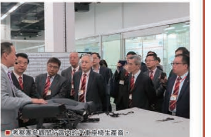
考察團參觀閔行區內的汽車生產商。