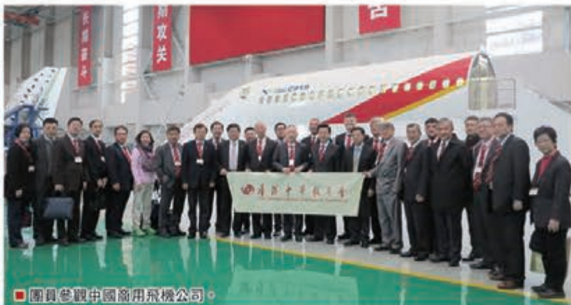
團員參觀中國商用飛機公司。